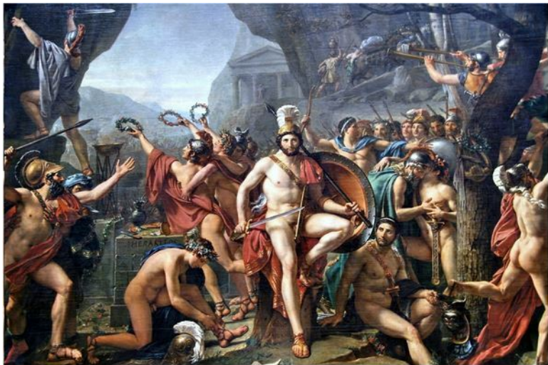
«Леонид в Фермопилах» Художник Ж.-Л. Давид. (1814)

Греческий флот в это время встречал неприятеля у Артемисия. На триерах царило полное спокойствие и уверенность. Выстроившись по ходу движения в широкую дугу, персы начали медленно окружать эллинов. С учетом понесенных персами потерь и подошедших к грекам резервов силы противников были примерно равными.