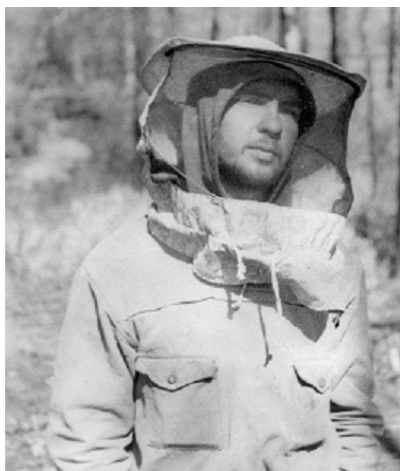
Пчеловодный накомарник удобнее

В четверг мы вышли из Пятницы, чтобы через четыре дня соединиться с караваном на заимке Илюшиной. Но вот кончается пятый день, а до заимки все еще далеко. Моросит дождь, под ногами хлюпает болото.