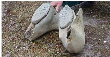
Челюсть мамонта (зубы)

Он достал из-за спины припрятанную «штуку». Она походила на высокий женский ботинок, подошву которого пересекали тонкие дентино-эмалевые пластинки.