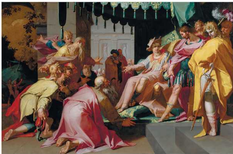
Абрахам Блумарт. Иосиф и его братья

Упоминания о переводчиках и переводе встречаются в Библии. Например, в книге «Бытие» в рассказе о встрече Иосифа с не узнающими его братьями говорится: «А того не знали они, что Иосиф понимает; ибо между ними был переводчик» (Быт. 42:23).