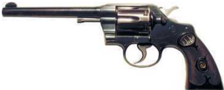
Револьвер «Полис спэшэл»