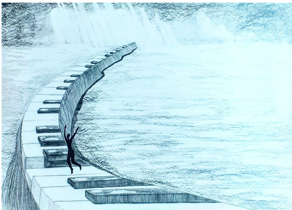
«Музыка», 2020 г.

Очнувшись от того, что Елена Григорьевна мягко обняла меня.