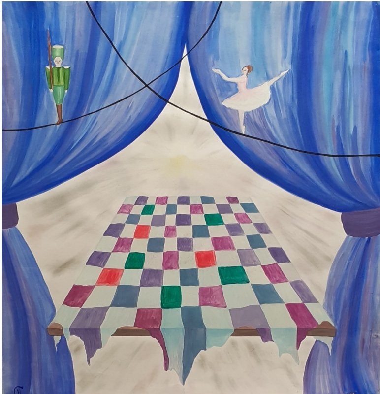
«Танец», 2006 г.