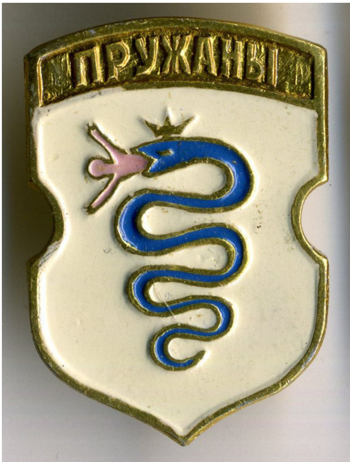
Герб Пружан.

«3 мая 1588 года Королева и Княгиня Великого княжества Литовского Анна Ягелонка (вдова Стефана Батория, она владела Пружанами после смерти своей матери – королевы Бона Сфорца) освободила местечко от земской зависимости, даровав ему Магдебургские привилегии вместе со статусом города, городской печатью и гербом.