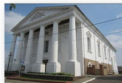
Костел св. Юзефа