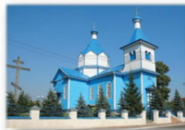
Церковь св. Константина и Елены