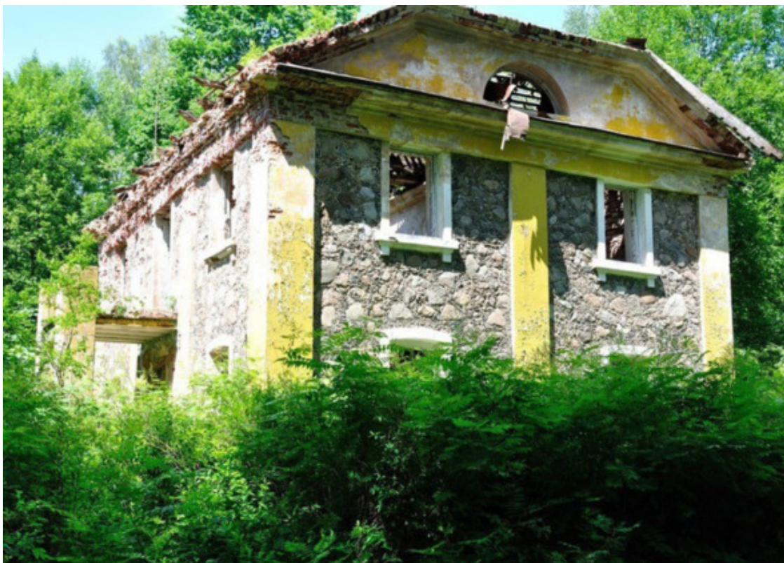
Вишнево: усадьба Хрептовичей «Одровонж» (Андрифонш)

«Вишнево (22 км) – центр металлургии (XVIII – XIX вв.): костел Марии (1637 – 1641), церковь Святых Козьмы и Демьяна (1865), усадьба Хрептовичей (нач. XX в.), дом израильского политика Шимона Переса (род. в 1923 г. в Вишневе), старые христианское и еврейское кладбища.