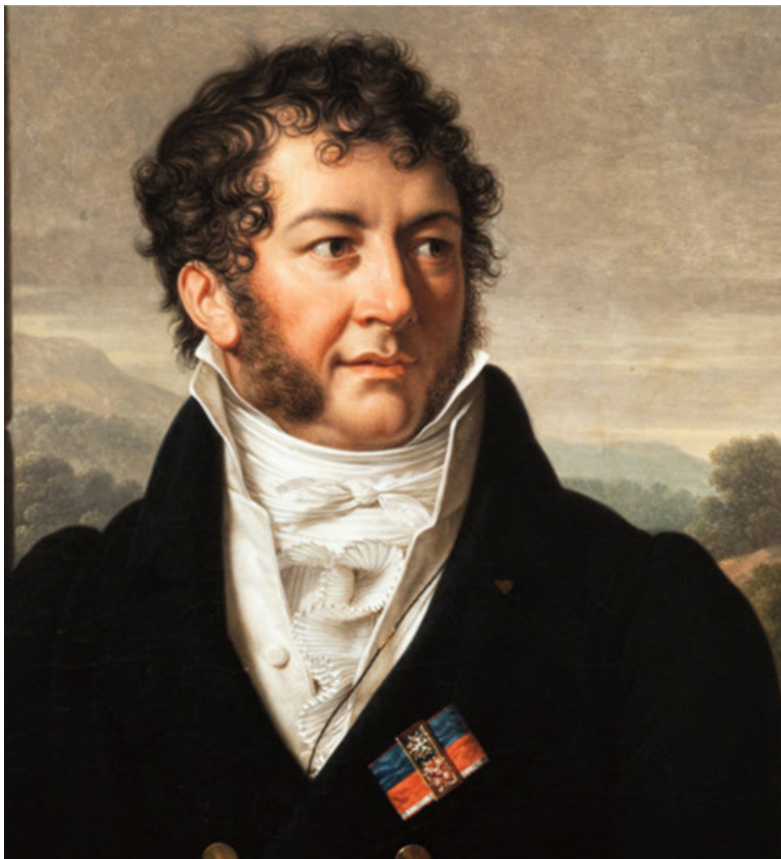
Михал Клеофас Огинский.

На территории района, где располагался Воложин [2]: