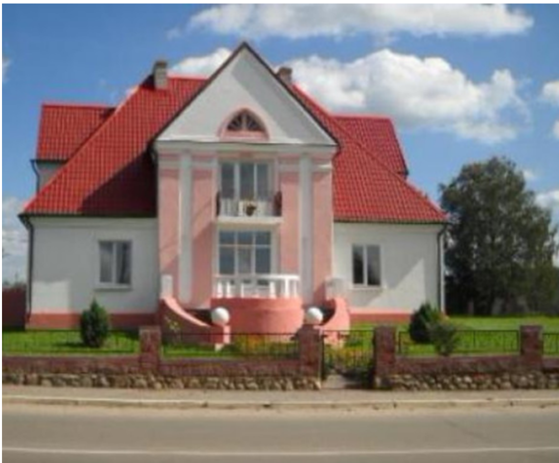
Воложин, краеведческий музей.

При районном центре культуры обеспечено функционирование объединения «Рунь» (литературно-художественного, народного).