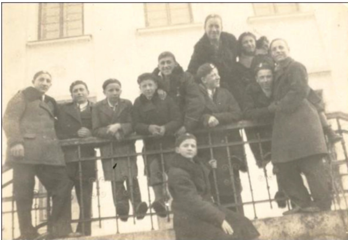
Młodzież przed gmachem Starostwa w Wołożynie marzec 1935r.

Год 1940-й (пятнадцатого января). Город стал районным центром.