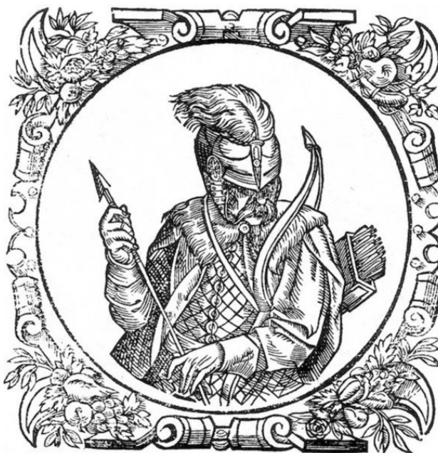
Свидригайло (Великий Литовский князь) Файл: Lithuanian Grand Duke Švitrigaila (2 Источник: https://ru.wikipedia.org/wiki/Свидригайл )

Если говорить о первом упоминании Воложина, принято считать, что оно имеет отношение к 1400 году. В данное время он был в собственности князей, пяти братьев, упоминаемых в «Хронике Быховца». Они пошли на поводу у православных князей, дав свое согласие на то, чтобы выступить против короля Польши Казимира 1У. В 1481-м г. всех братьев постигла гибель.