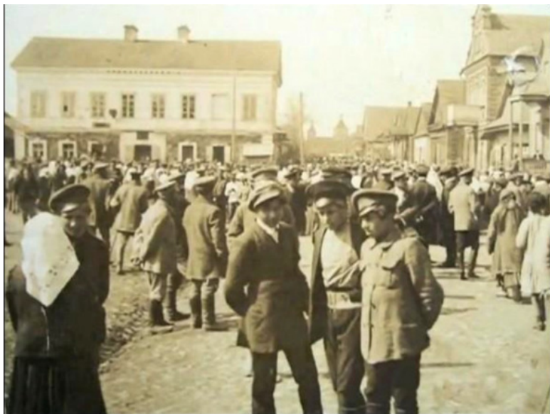
Иешива. Jeszybot w Wołożynie XIXw