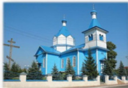
Церковь св. Константина и Елены