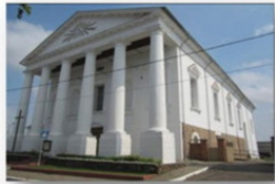
Костел св. Юзефа