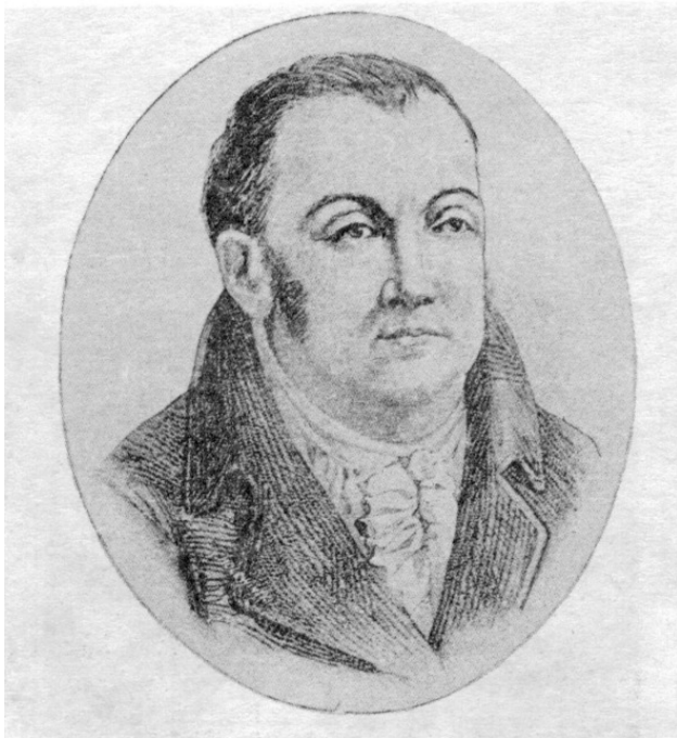
Граф Винцент Тышкевич. Файл: Граф_Винцент_Тышке- вич Источник: https://ru.m.wikipedia.org/wiki/

«имение Воложин Ошмянского уезда принадлежало графу Тышкевичу. В имении насчитывалось 3788 крепостных душ мужского пола (в том числе 28 дворовых) и 843 дворов, из которых 282 двора