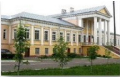
Дворцово-парковый ансамбль Тышкевичей