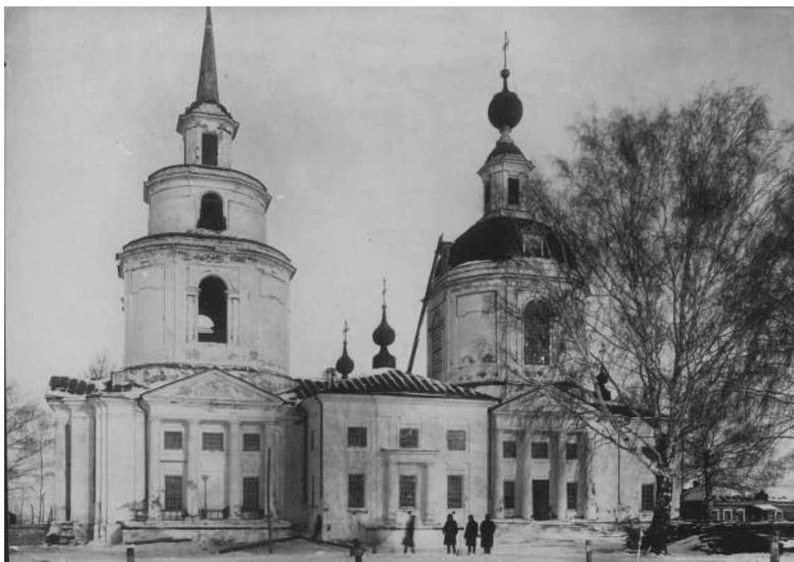
Церковь в 20-х годах.