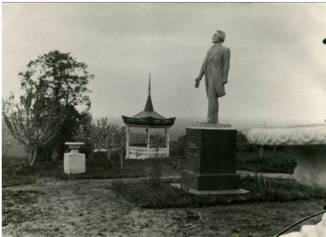
«Китайская» беседка и памятник Белинскому. 1957 год.