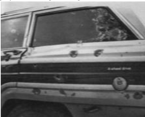
Машина ИСД, изрешеченная пулями