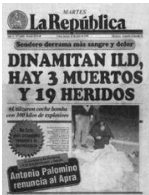
Подрыв здания ИСД

Мы уже не в первый раз становились мишенью террористической атаки. Группировка «Сверкающий путь», терроризировавшая население Перу с 1980 г., считала ИСД своей интеллектуальной Немезидой. Они и прежде минировали наши помещения, обстреливали наши автомобили и угрожали нашим сотрудникам. Поэтому имевшееся у нас предчувствие того, что нападение неминуемо повторится, на этот раз спасло немало человеческих жизней. За три минуты до взрыва бомбы мы услышали уже хорошо нам знакомый треск выстрелов, направленных в сторону нашего здания. Это был прием, с помощью которого нападавшие хотели вынудить охранников здания укрыться на внешних стенах, защищавшими здание ИСД. Тогда у группы командос из «Сверкающего пути» появлялась возможность доставить поближе к зданию института гораздо больший смертоносный груз – в данном случае, согласно проведенному полицией расследованию, это был автомобиль, начиненный четырьмя центнерами динамита и нитрата аммония. Начавшийся обстрел послужил для нас предупредительным сигналом, позволившим выиграть несколько драгоценных секунд, чтобы шмыгнуть в укрытие и увернуться от попадания смертоносных осколков, которые через мгновение стали со свистом проноситься через наши кабинеты.