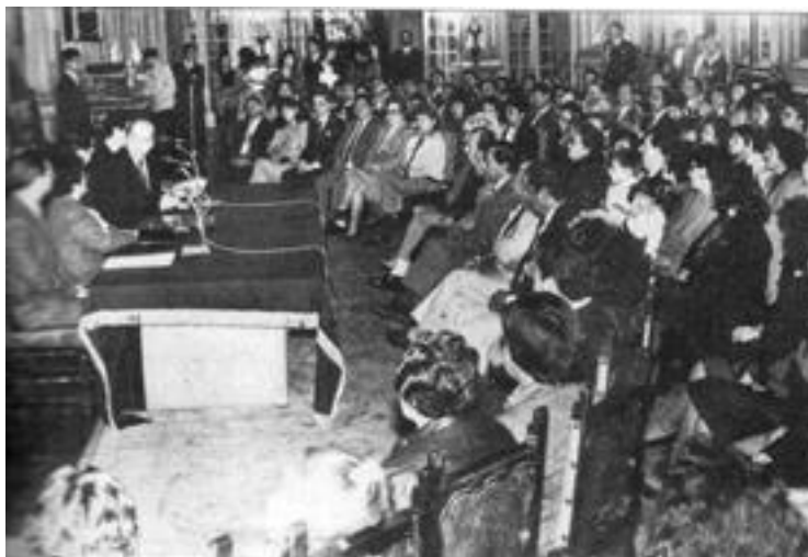
Трибунал по упрощению административных процедур

лись сотни узлов, до этого не дававшие им свободно вздохнуть. Время, которое раньше требовалось для полного выполнения сотен различных официальных процедур, таких как получение паспорта, подача заявления на поступление в университет, получение лицензии на заключение брака – да буквально на все подряд! – сокращалось самое меньшее на 75 %. Если раньше для получения лицензии на заключение брака требовалось 720 часов на преодоление бюрократических препятствий, то теперь это время было сокращено до 120 часов – существенная помощь женщинам в обеспечении их прав как партнеров в супружестве. Тот же самый закон, который создал эти процедуры, содержал в себе также механизмы, позволившие правительству провести большинство структурных реформ, требовавшихся для интеграции Перу в глобальную экономику.