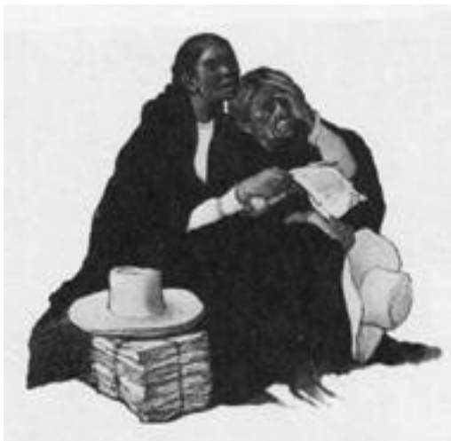
В ожидании правосудия (Teodoro Nunez Ureta)

В целом эти и сотни других реформ помогли правительству Перу улучшить свою репутацию в глазах граждан. Для оказания помощи в составлении проектов законов и нормативных актов ИСД неизменно включал традиционно сложившиеся внезаконные принципы, которые были понятны простым людям, уважались ими и которым они следовали.