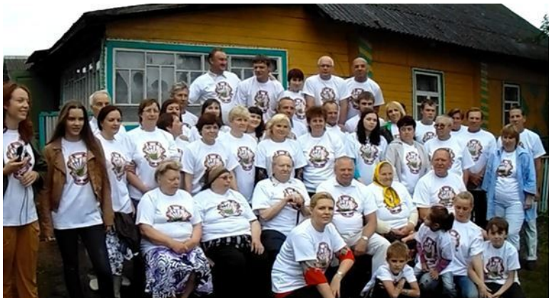
Наше живое семейное древо