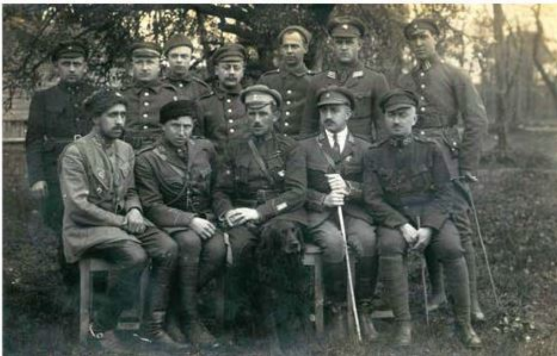
Генерал Булак-Балахович (в первом ряду, третий справа)

Во время советско-польской войны 1920 года он организовал под командованием генерала Станислава Булак-Балаховича 11 антисоветские военные отряды, которые сражались на стороне Польши. Лично принимал участие в боевых действиях в качестве рядового.