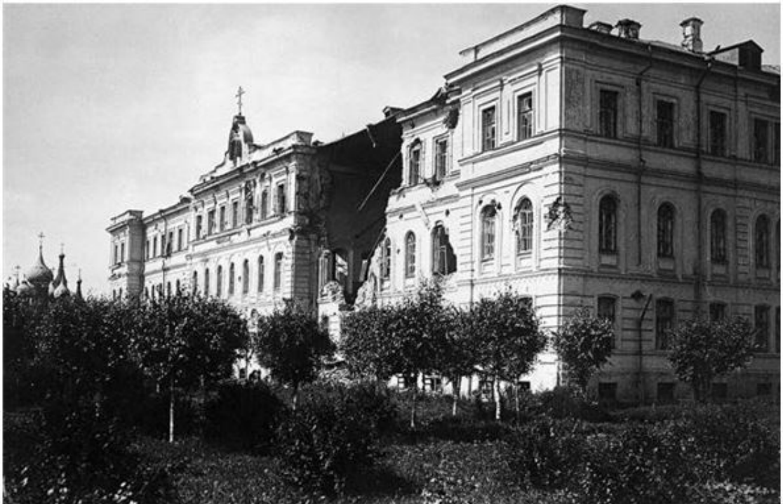
Руины домов и церквей Ярославля – последствия разрушений в ходе антибольшевистских восстаний