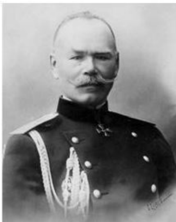
Генерал Михаил Васильевич Алексеев

Октябрьскую революцию Савинков встретил враждебно, считая, что «Октябрьский переворот не более как захват власти горстью людей, возможный только благодаря слабости и неразумию Керенского». Пытался помочь осажденному в Зимнем дворце Временному прави-