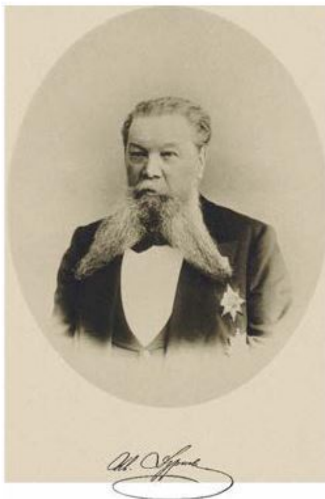
Иван Николаевич Дурново, русский государственный деятель, министр внутренних дел