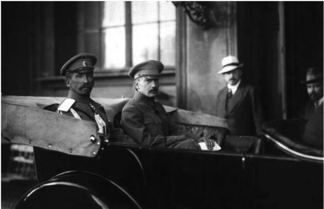
Б. Савинков с генералом Л. Корниловым покидают Зимний дворец после заседания