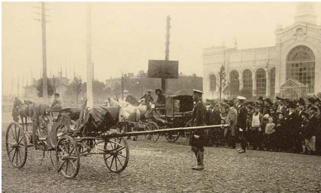
Площадь у Варшавского вокзала, остаток кареты министра В. Плеве (Санкт-Петербург)