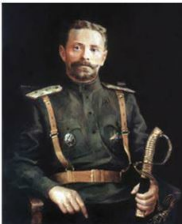
Генерал Владимир Оскарович Каппель

– У меня паспорт, выданный Северной коммуной. Теперь я нахожусь в пределах Нижегородской советской республики. Вы будете очень любезны, если выдадите мне от себя соответствующее удостоверение.