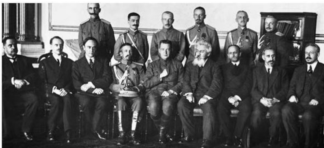
На заседании Временного правительства. Б. Савинков во втором ряду третий слева Л. Корнилов и А. Керенский в первом ряду в центре.