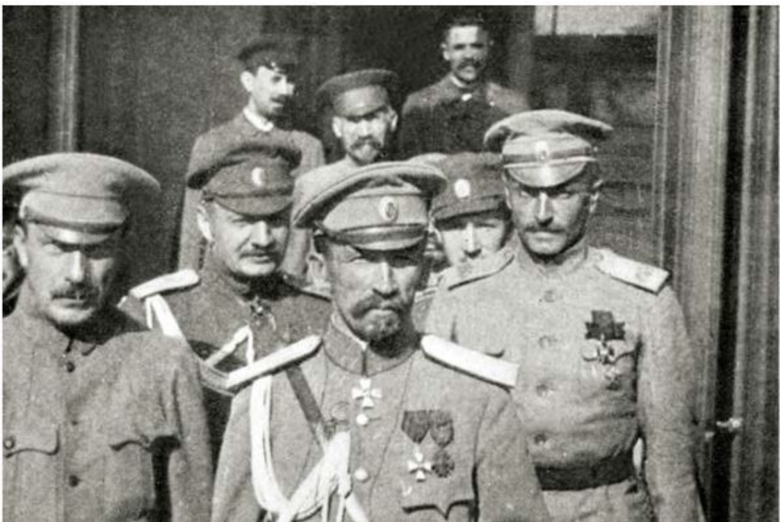
Б. Савинков с генералом Л. Корниловым во время «Корниловского мятежа» (Савинков крайний слева)