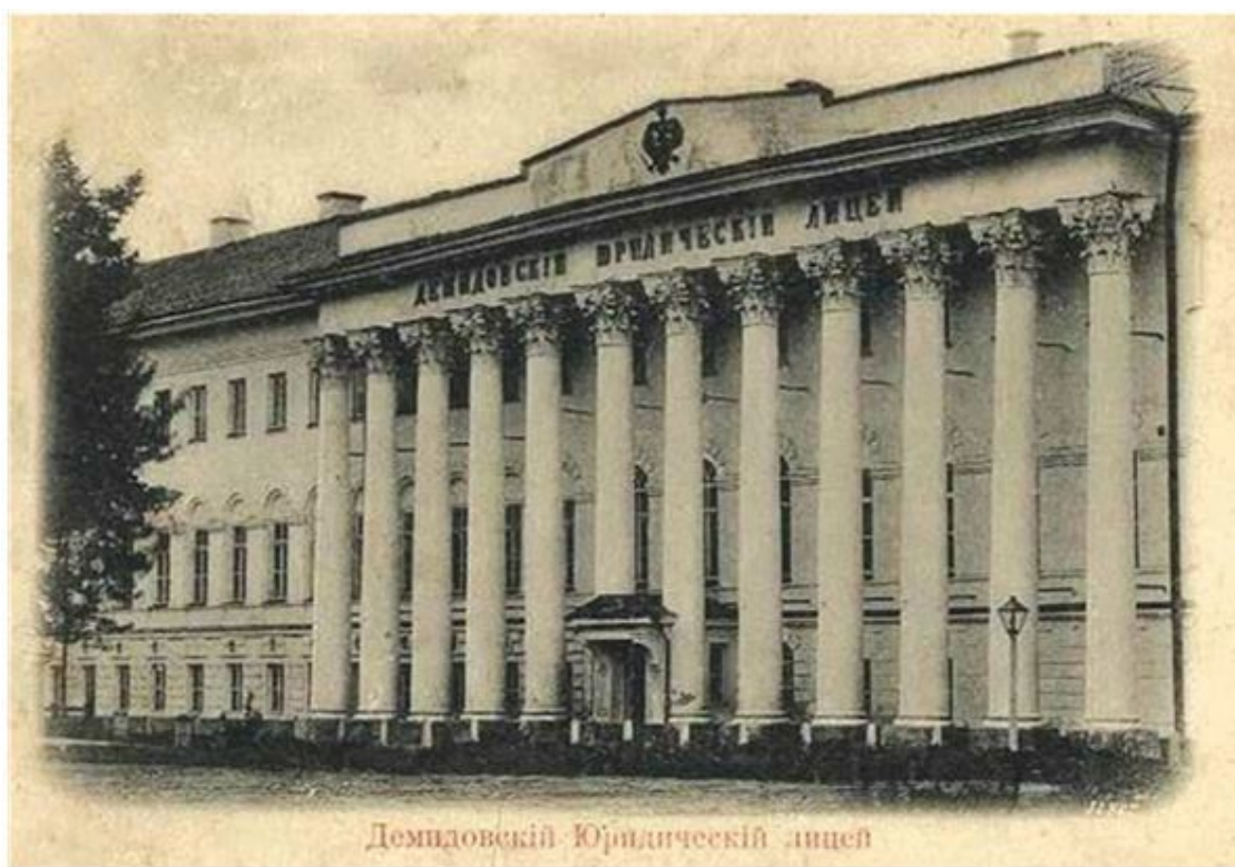
Демидовский юридический лицей и его развалины после обстрела города Ярославля

После подавления восстаний Б. Савинков был вынужден бежать сначала в Петроград, а затем в занятую военнопленными чехами Казань.