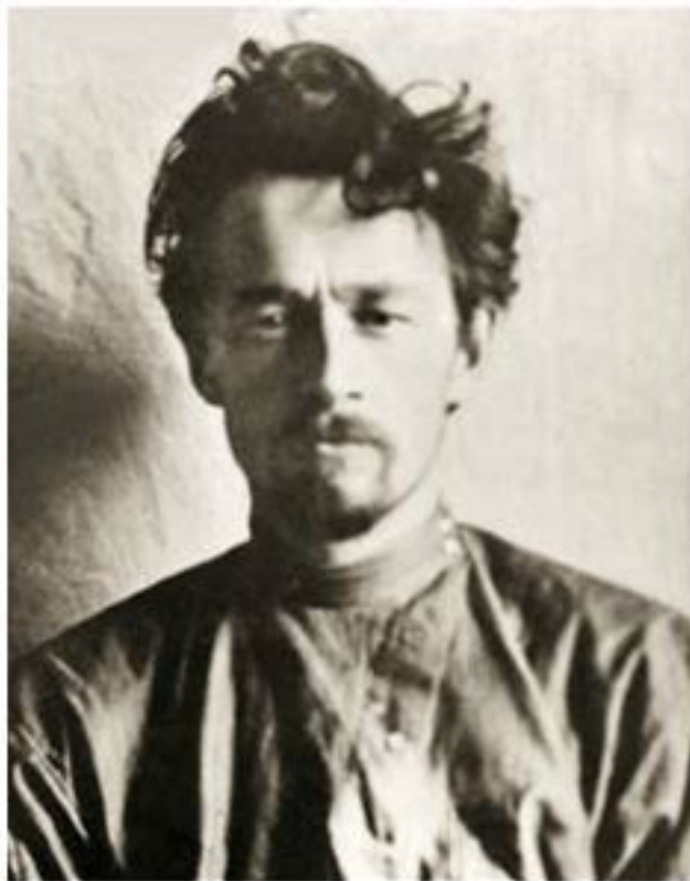
Егор Созонов, непосредственный исполнитель убийства В. Плеве