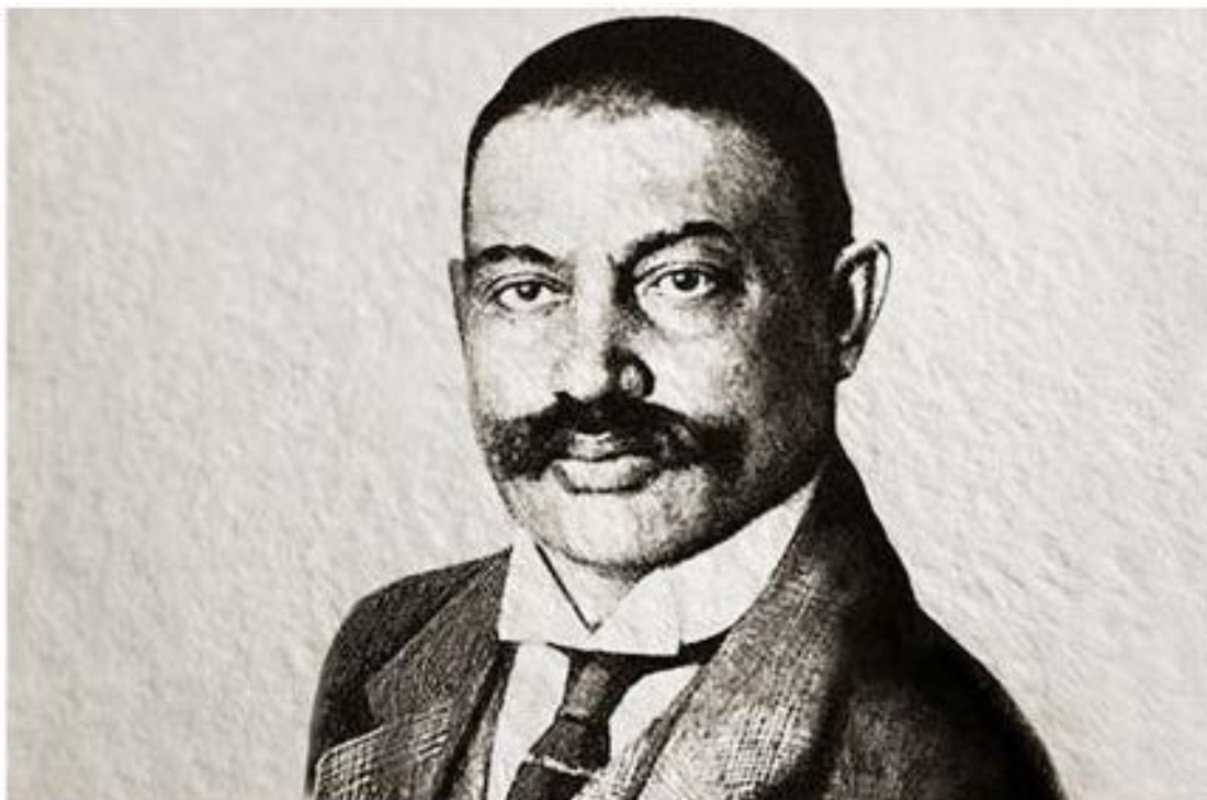
Евно Фишелевич Азеф, руководитель «Боевой организации» и одновременно агент Департамента полиции

Для того чтобы избежать раскрытия, часть терактов Азеф готовил втайне от Департамента полиции. О других терактах Азеф своевременно сообщал в Департамент. Организовал закупку и доставку в Россию оружия для рабочих в целях осуществления вооруженного восстания. Однако осенью 1905 года Азеф передал полиции все планы восстания, для которого предназначалось оружие. В 1906 году предотвратил покушение «Боевой организации» на министра внутренних дел П. Дурново. В 1907 году предотвратил покушение на Николая II. В 1908 году выдал полиции революционеров, входящих в состав боевых отрядов и ЦК партии, результатом чего был их арест. Инициировал физическое устранение революционерами Г. Гапона, как провокатора.