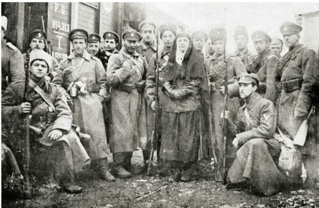
Пехотная рота Добровольческой армии, сформированная из гвардейских офицеров. Январь 1918 г.

тельству, о чем вел переговоры с генералом М.В. Алексеевым 4 . После ареста Временного правительства и взятия Зимнего дворца уехал в Гатчину, где был назначен комиссаром Временного правительства при отряде генерала П.Н. Краснова и участвовал в неудавшемся походе на Петроград 5 . Позднее на Дону занимался формированием Добровольческой армии, входил в антисоветский Донской гражданский совет. Вскоре Савинков вынужден был уехать с Дона и продолжил борьбу с советской властью в Москве.