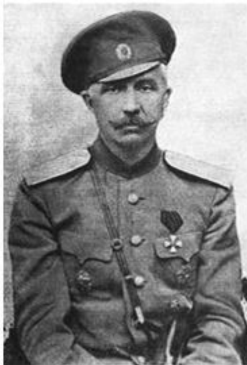
Петр Николаевич Краснов, генерал-майор Русской императорской армии