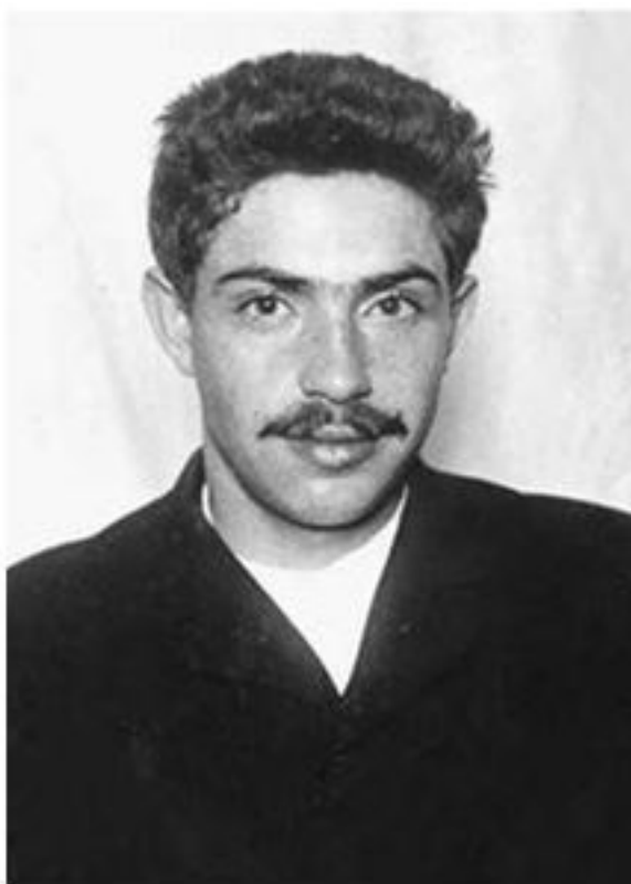
Лейба Вульфович Сикорский, российский революционер начала XX века, член «Боевой организации» эсеров