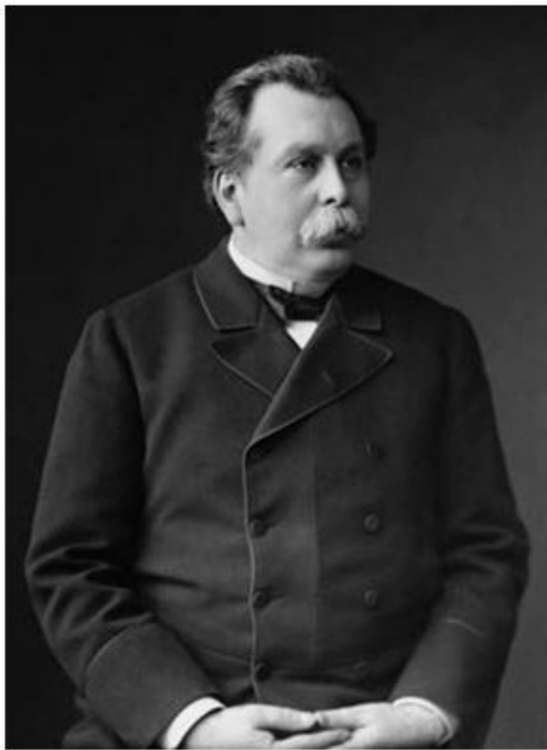
Вячеслав Константинович фон Плеве, российский государственный деятель