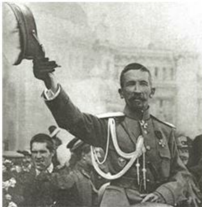
Генерал Лавр Георгиевич Корнилов в ходе наступления на Петроград

Впоследствии А. Керенский получил телеграмму от Л. Корнилова: «До меня дошли сведения, что Савинков подал в отставку. Считаю долгом доложить свое мнение, что оставление таким крупным человеком, как Борис Викторович, рядов Временного правительства не может не ослабить престижа правительства в стране, и особенно в такой серьезный момент. При моем выступлении 14 августа я нахожу необходимым присутствие и поддержку Савинковым моей точки зрения, которая вследствие громадного революционного имени Бориса Викторовича и его авторитетности в широких демократических массах приобретает тем большие шансы на единодушное признание...» В результате Керенский отставки Савинкова не принял.