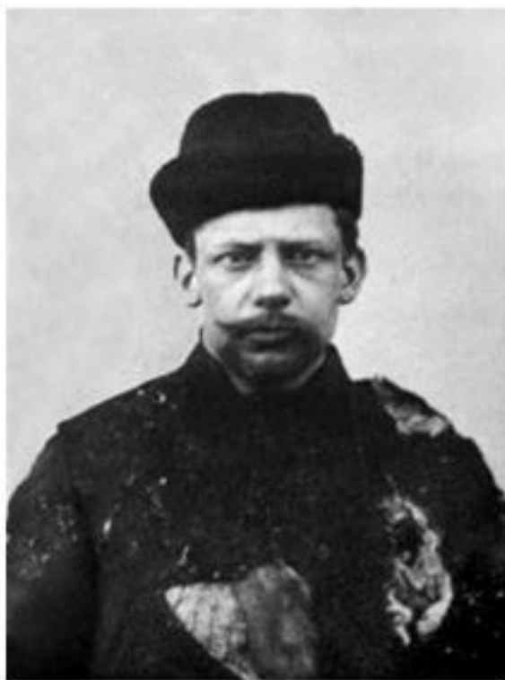
Иван Каляев после покушения на великого князя Сергея Александровича