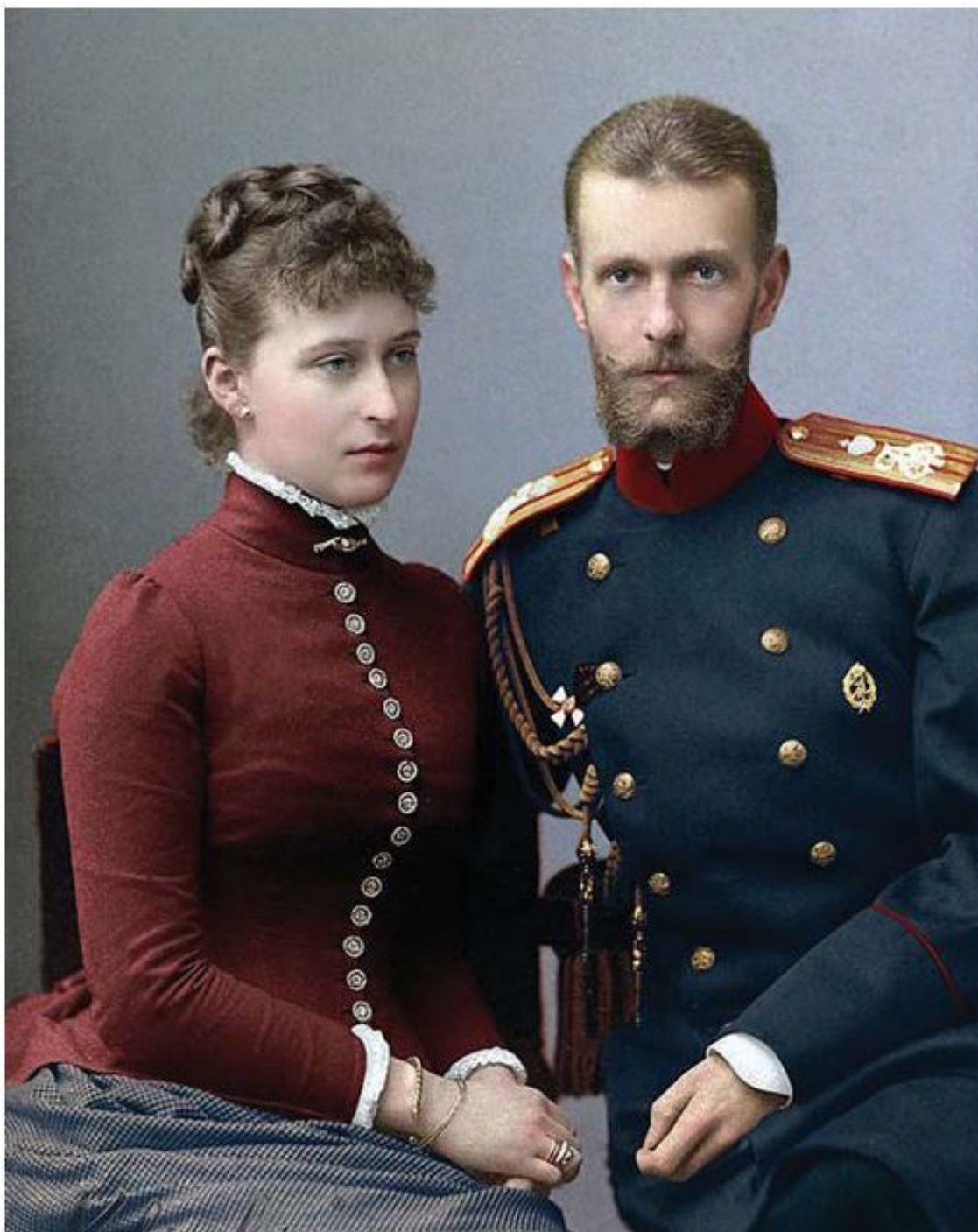
Великий князь Сергей Александрович со своей супругой великой княгиней Елизаветой Федоровной

Убийство Каляеву удалось совершить только со второй попытки, поскольку первоначально в экипаже Сергея Александровича находились также жена и дети 1 , на которых приговор «Боевой организации» не распространялся.