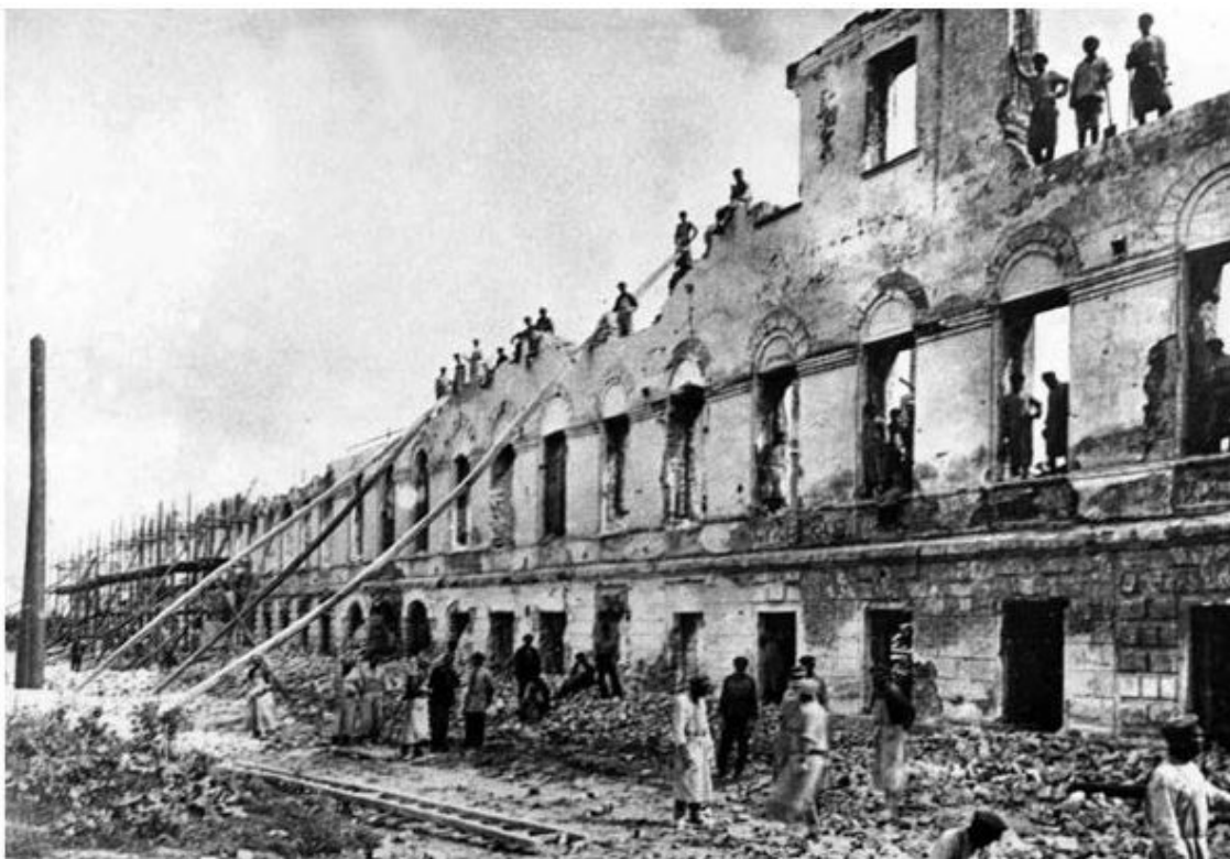
Ярославль. Тактика «выжженной земли»