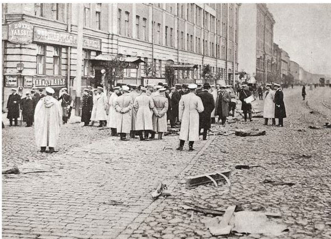
Следственная комиссия на месте убийства В. Плеве