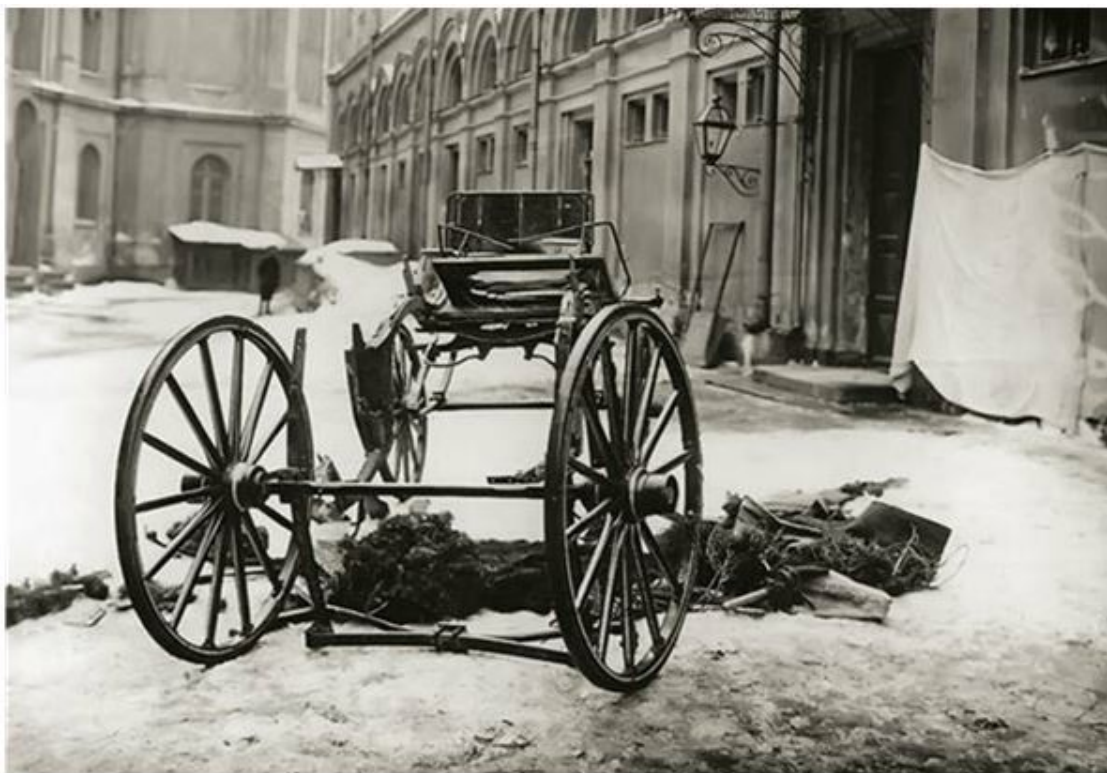
Москва. Разрушенная взрывом карета, в которой находился великий князь Сергей Александрович