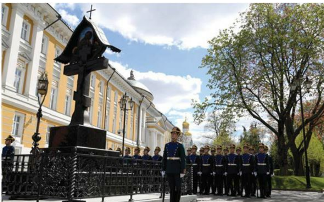
Восстановленный крест на месте гибели князя Сергея Александровича

Б. Савинков также участвовал в покушениях на московского генерал-губернатора адмирала Ф.В. Дубасова и на министра внутренних дел И.Н. Дурново.