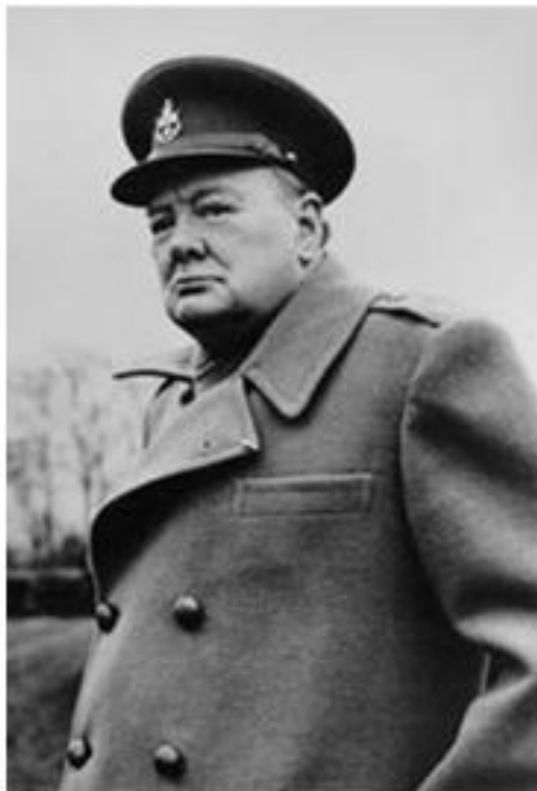
Премьер-министр Великобритании Уинстон Леонард Спенсер Черчилль

По оценке известного английского писателя Сомерсета Моэма, Савинков был одним из самых удивительных людей, каких ему доводилось встречать.