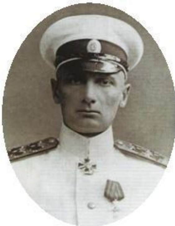
Адмирал Александр Васильевич Колчак