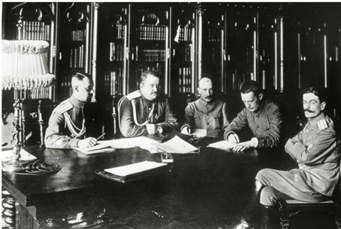
Б. Савинков (третий слева) и А. Керенский (второй справа)

ство в Учредительном собрании. Вскоре Савинков получил должность комиссара 7-й армии, а затем комиссара Юго-Западного фронта. Савинков активно выступал за продолжении войны до победного конца. Поддерживал генерала Л.Г. Корнилова в его решении ввести смертную казнь. В середине июля 1917 года А.Ф. Керенский по ходатайству Савинкова уволил находящегося на посту Верховного Главнокомандующего генерала А.А. Брусилова и назначил на эту должность генерала Л.Г. Корнилова.