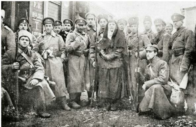
Пехотная рота Добровольческой армии, сформированная из гвардейских офицеров. Январь 1918 г.

В феврале – марте 1918 года Савинков организовал в Москве подпольный контрреволюционный «Союз защиты Родины и Свободы» (СЗРС), в который входили в основном офицеры и юнкера.