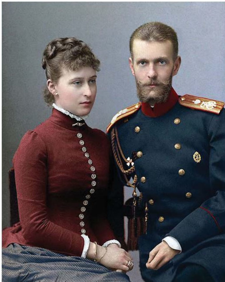
Великий князь Сергей Александрович со своей супругой великой княгиней Елизаветой Федоровной