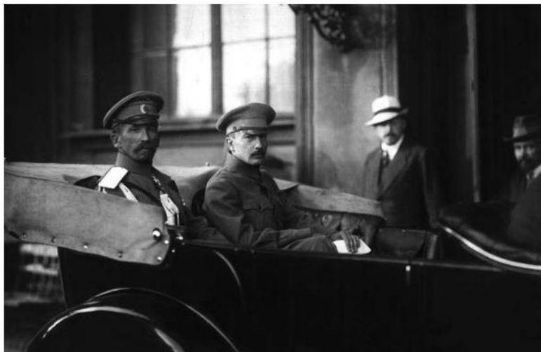
Б. Савинков с генералом Л. Корниловым покидают Зимний дворец после заседания

Кроме того, Б. Савинков был вызван в ЦК партии эсеров для разбирательства по так называемому «Корниловскому делу». На заседание он не явился, посчитав, что партия больше не имеет «ни морального, ни политического авторитета», за что и был исключен из партии эсеров.