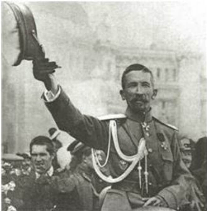
Генерал Лавр Георгиевич Корнилов в ходе наступления на Петроград

В конце августа 1917 года при наступлении генерала Л.Г. Корнилова на Петроград с целью установить военную диктатуру Б. Савинков, занимавший на тот момент должность военного губернатора Петрограда и исполняющего обязанности командующего войсками Петроградского военного окру-