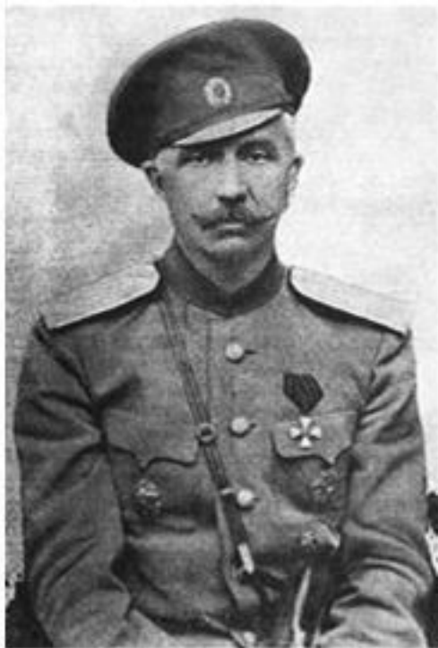
Петр Николаевич Краснов, генерал-майор Русской императорской армии