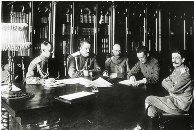
Б. Савинков (третий слева) и А. Керенский (второй справа)