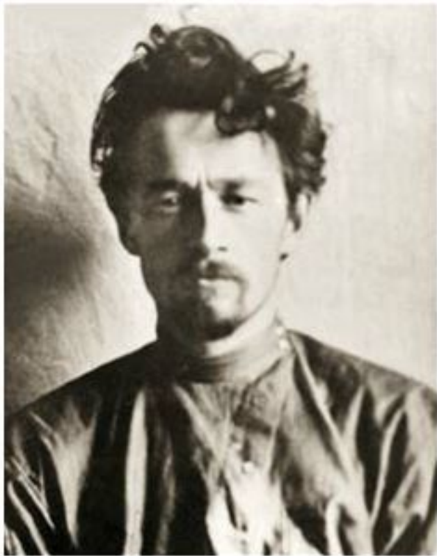
Егор Созонов, непосредственный исполнитель убийства В. Плеве