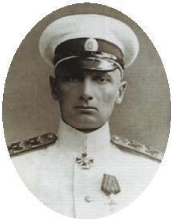
Адмирал Александр Васильевич Колчак

полнял во Франции должность представителя правительства А.В. Колчака. Вел переговоры с правительствами Антанты о помощи Белому движению. Организовывал обеспечение белой армии вооружением. Принимал участие в «Русской заграничной делегации» при обсуждении Версальского договора по итогам Первой мировой войны.