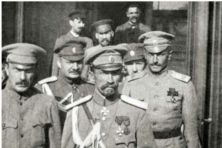
Б. Савинков с генералом Л. Корниловым во время «Корниловского мятежа» (Савинков крайний слева)