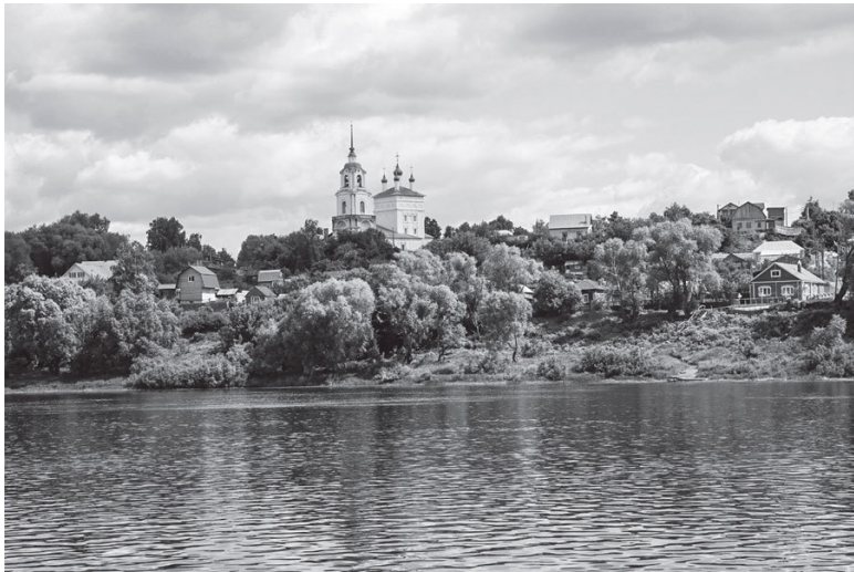
Вид на Касимов со стороны реки

Еще один эпизод моего раннего детства (его тоже сам не помню, знаю только по рассказам). Монахини, несшие у нас клиросное послушание, поставили меня на табурет на клиросе, чтобы я читал шестопсалмие. Я читал довольно успешно, но в какой-то момент замолчал, и у меня полились слезы. Одна монахиня продолжила чтение, а меня сняли с табурета и посадили на скамеечку – отдыхать.