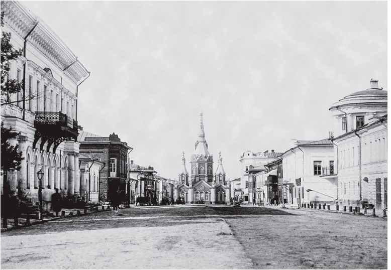
Касимов, ул. Большая, вид на Вознесенский собор

ми участниками всех мероприятий, кроме антирелигиозных или предпринимаемых в насыщенное священными воспоминаниями и богослужениями время.