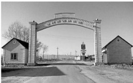
Въезд в селение Эндирей