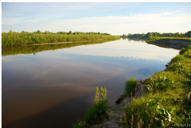
Река Горынь.

«... главным занятием городочков и по сей день остается выращивание цветов. Цветы здесь повсюду – в огородах и палисадниках, ими расписаны старые сундуки, украшены потиры, а также Царские врата Георгиевской церкви. „Цветы – основа давид-городокского стиля, это философия жизни, смысл которой сводится к понятной мысли: не надейся на чужое, а только на свое“, – подметил как-то уроженец этих мест, известный белорусский поэт Леонид Дранько-Майсюк». [4]