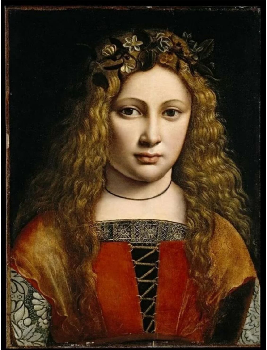
Джованни Антонио Больтраффио, 1467—1516, портрет Боны Сфорца.

«1100 г. – основание Давид-Городка князем Давидом, внуком Ярослава Мудрого