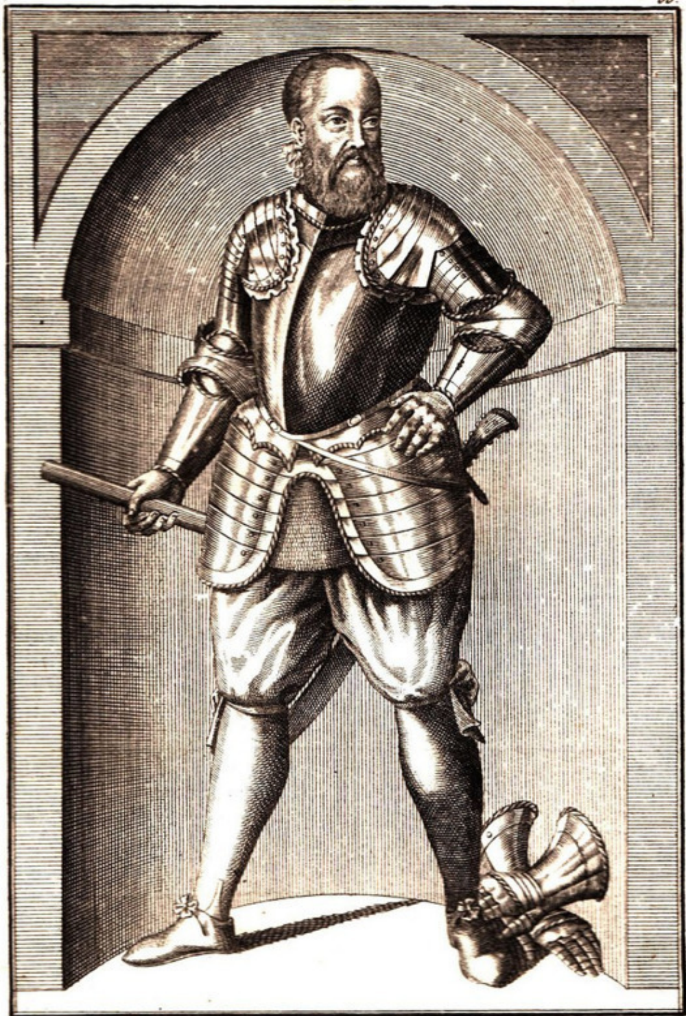
LXVI. NICOLAUS RADZIVIL.

Портрет Мікалая Радзівіла «Чорнага» (Mikołaj Radziwiłł «Czorny»).