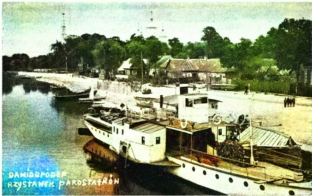
מקום ענינת אניות הקיסור בדויד'הרודוק דער פריסטאן פון די «פאראכאנד» אין דאויד'הארדאק

Старинная фотография Давид-городка.