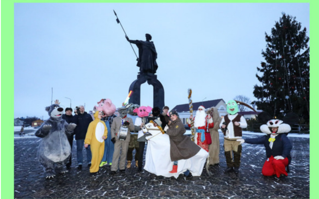
«Коники» в Давид-Городке.