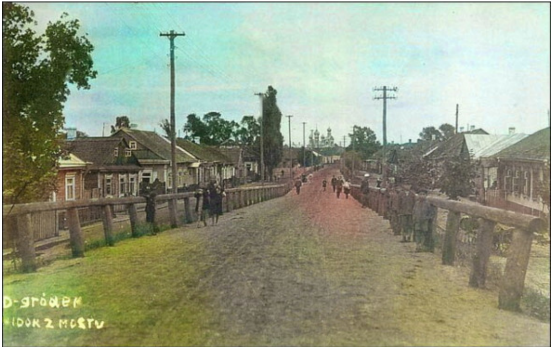
Старинная фотография Давид-городка.

евреев это не коснулось. Евреи могли и дальше торговать и заниматься ремесленничеством, держать бани, парикмахерские, магазины, разного рода мастерские, пилорамы, аптеки и др. Евреи в Давид – Городке составляли почти половину всего населения [3]: