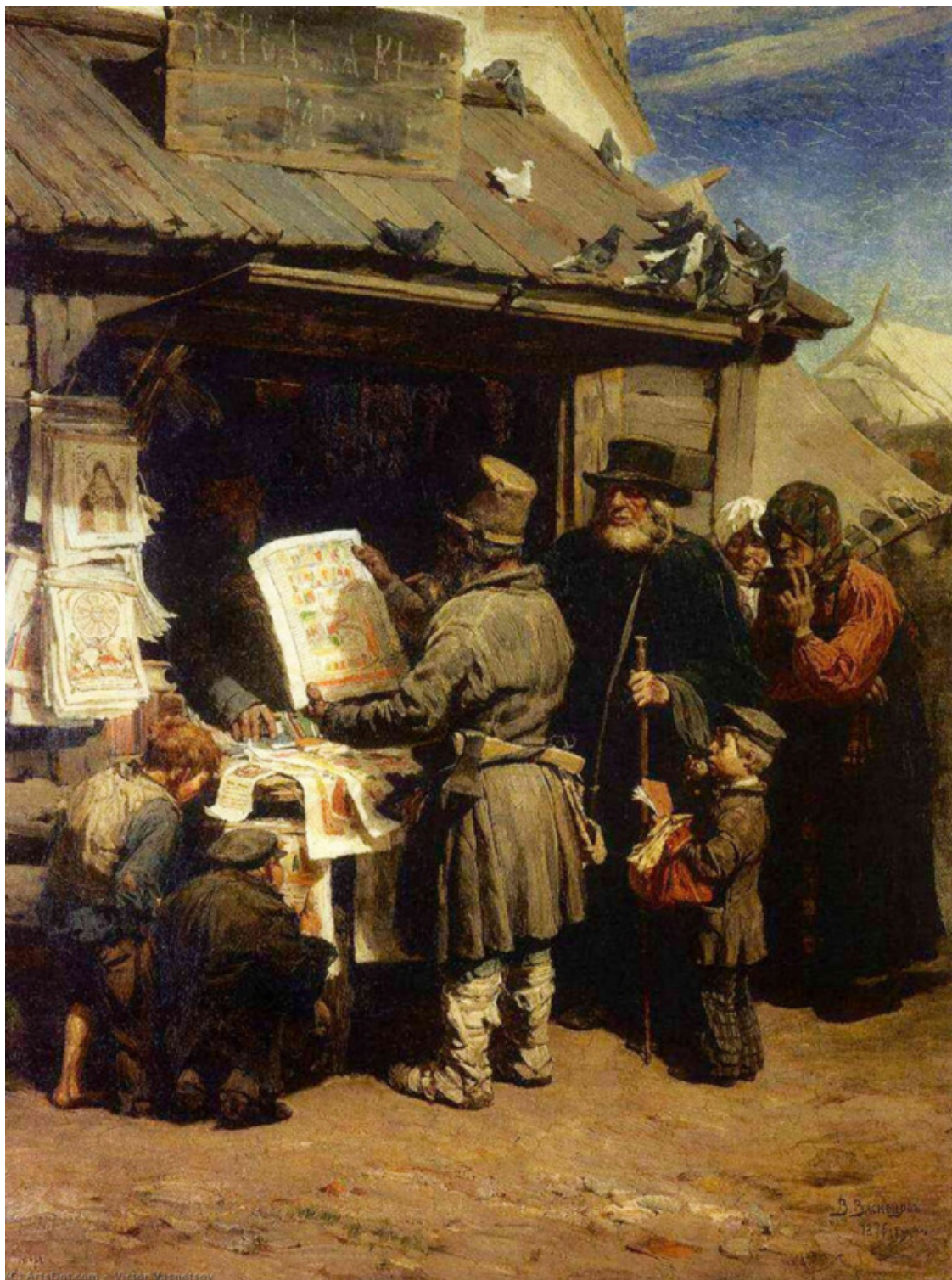
Книжная лавочка. Васнецов ВМ.