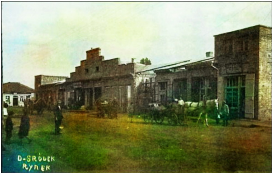
Давид-городок на старинной фотографии.

«Торговля довольно значительная, куда стекаются из дальних мест окрестные жители, чтобы продать или передать комиссионерам для развоза по другим городам свои домашние заготовки, как, например, сушёную рыбу, дичь в разных видах, грибы, сушёные сливки и т.п., но главное, чем славились сапожники Давид-Городка, – это высокие, с длинными голенищами сапоги. Всё это ежегодно привозится в Вильно, Варшаву и другие города. Местные жители также известны отличной отделкой плетёных брочек...».