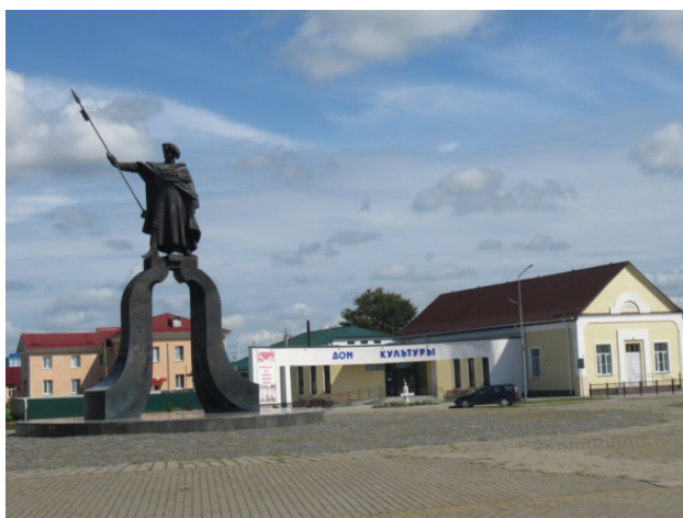
Давид-Городок. Памятник князю Давиду, скульптор Александр Дранец, 2000г.

«... главным занятием городочков и по сей день остается выращивание цветов. Цветы здесь повсюду – в огородах и палисадниках, ими расписаны старые сундуки, украшены потиры, а также Царские врата Георгиевской церкви. „Цветы – основа давид-городокского стиля, это философия жизни, смысл которой сводится к понятной мысли: не надейся на чужое, а только на свое“, – подметил как-то уроженец этих мест, известный белорусский поэт Леонид Дранько-Майсюк». [4]