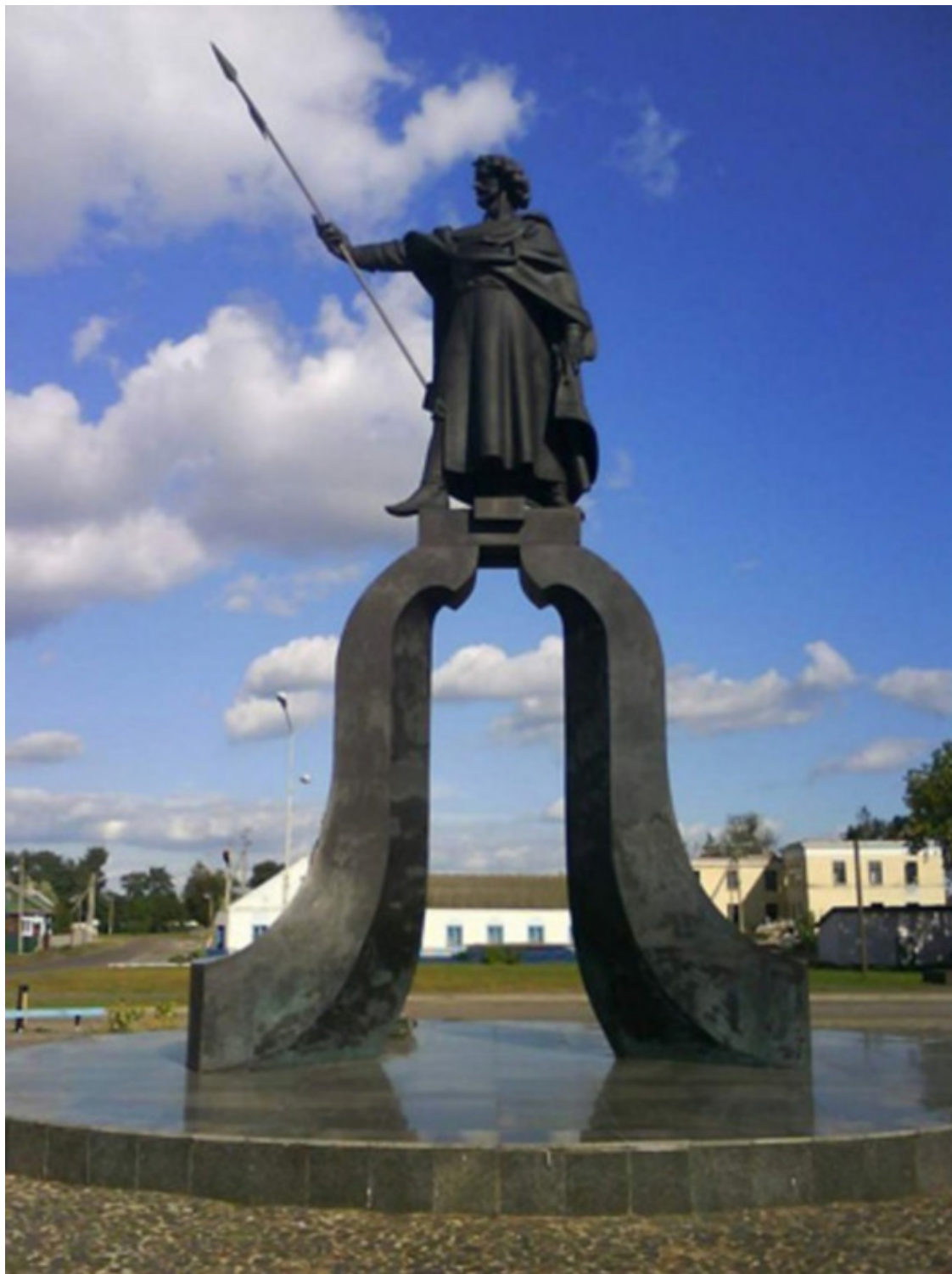
Давид-Городок. Памятник князю Давиду, скульптор Александр Дранец, 2000г.