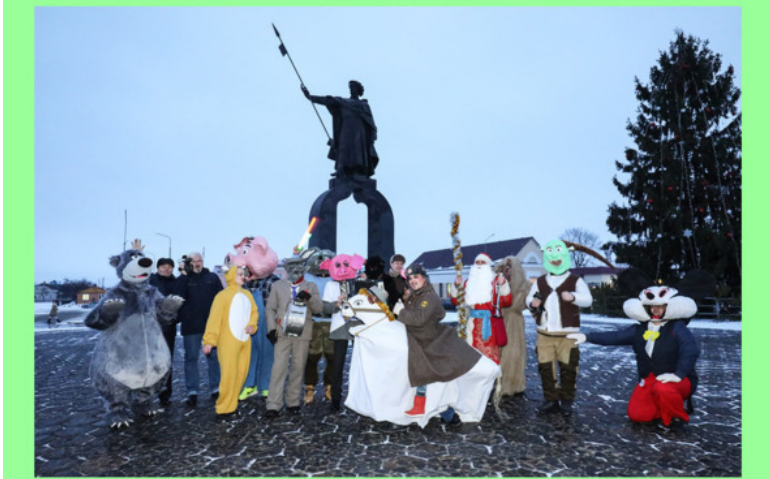
«Коники» в Давид-Городке.