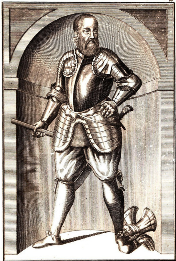
LXVI. NICOLAUS RADZIVIL.