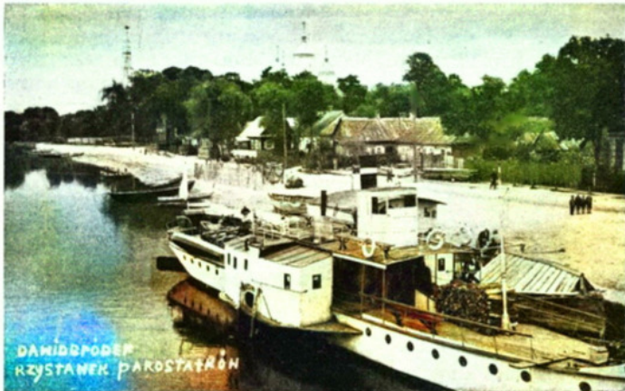
מקום ענינת אניות הקיסור ברוי'הורודוק דער „פריסטאן“ פון די „פאראכאנד“ אין דאזי'גארטאק

Старинная фотография Давид-городка.