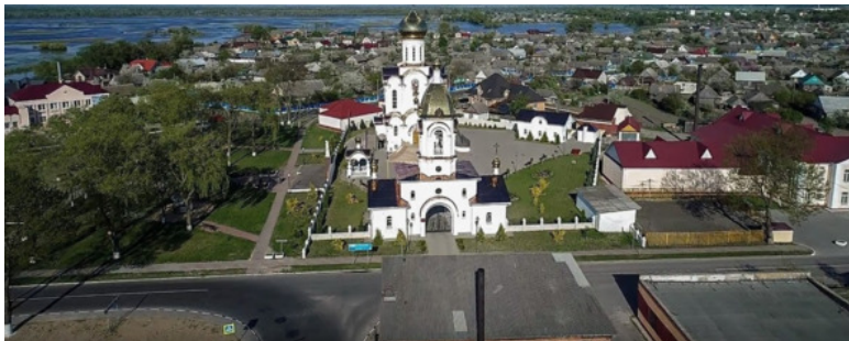
Фото Турова. Источник: https://www.youtube.com/watch?v=tUpZryIMiTo&app=desktop

В конце девятнадцатого столетия в беларуском городе Турове доля евреев превалировала над пятьюдесятью процентами. Поэтому, если говорить о данном древнем городе, о его истории, необходимо говорить о его евреях.