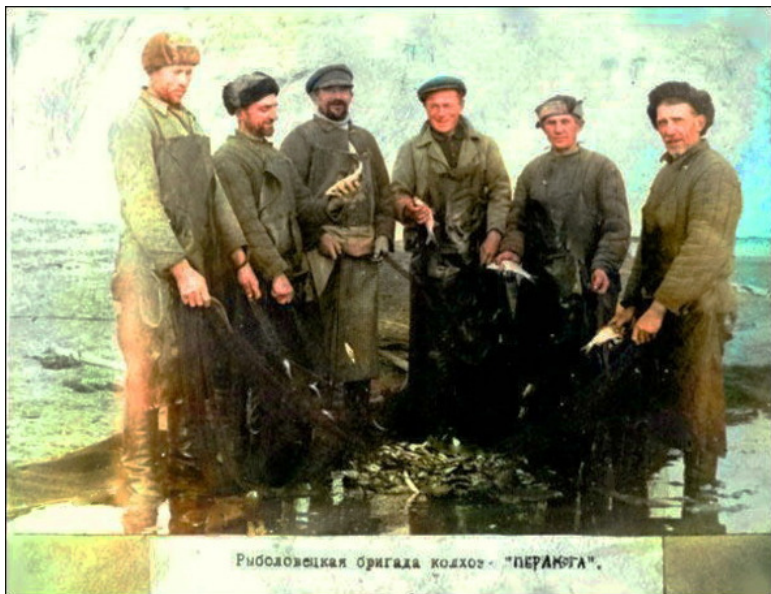
Рыболовецкая бригада колхоз - "ПЕРАЖГА".

«С февраля 1918 г. до января 1919 Туров оккупирован войсками кайзеровской Германии, 10.7.1919 г. – польскими войсками, в июле 1920 – Красной армией. 14.10.1920 занят войсками под командованием генерала Булак-Балаховича. 7 ноября 1920 в Турове состоялась торжественное мероприятие передачи Белорусскому политическому комитету из рук генерала Булак-Балаховича гражданской власти «над освобожденной землёй Белорусской Народной Республики». [18]