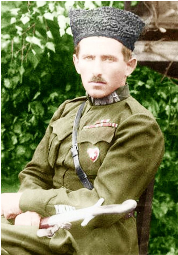
Станислав Булак-Балахович.