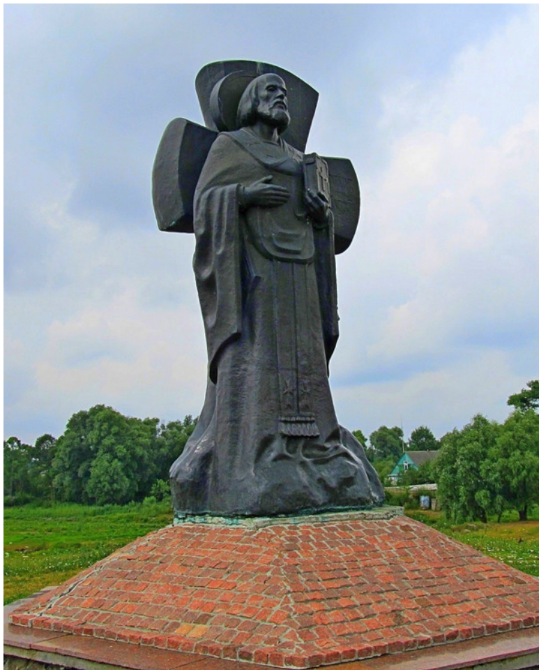
Памятник Кириллу Туровскому в Турове.