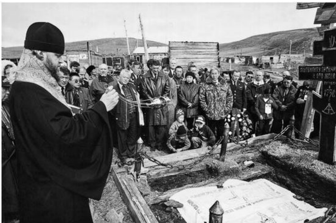
Отпевание. Епископ Якутский и Ленский Герман у могилы Прончищевых.