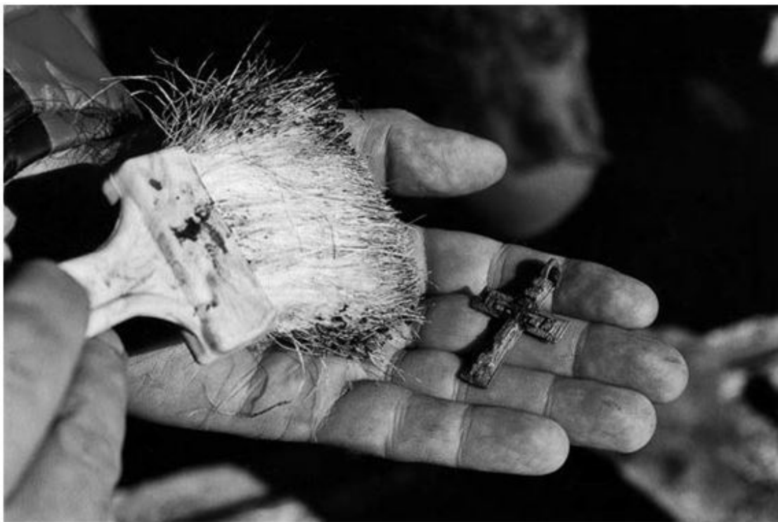
Крест, который носила Т. Прончищева. (Экспонат Калужского краеведческого музея.)