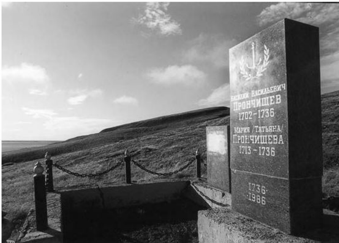
Усть-Оленёк, Республика Саха (Якутия). Памятник Прончищевым, привезенный из Якутска.

По судовым записям, во время похорон Татьяны шел снег и было очень холодно. Но моряки положили ее в гроб в изящных туфельках. В них она могла танцевать неторопливую мазурку в одном из дворцов Петербурга вместе со своим возлюбленным! Жители Крайнего Севера почти три сотни лет зовут место захоронения Татьяны и Василия Прончищевых возле Усть-Оленёка «землей испытания любви».