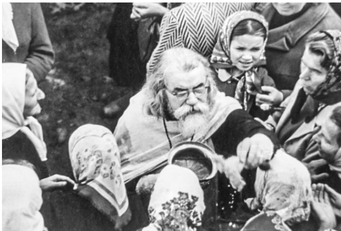
Окропление святой водой, 1980-е годы

И подавайте, подавайте воды всякому, кто будет нуждаться: стакан, наполненный простым участием к человеку, нуждающемуся в нем. Этой воды во всяком месте целые реки – не бойтесь, не оскудеет, почерпните каждому по стакану.