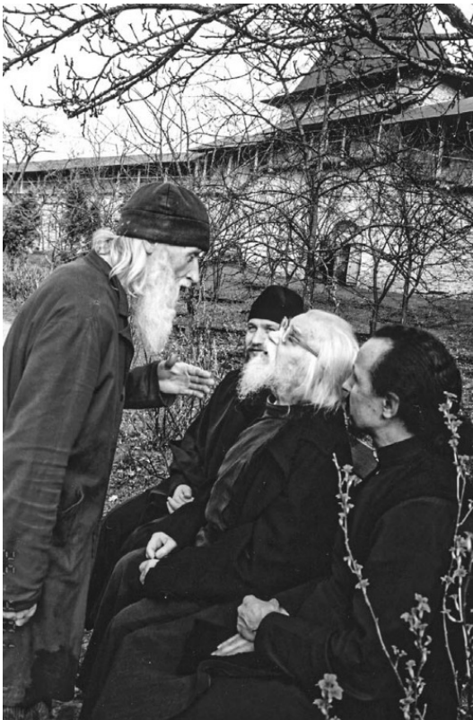
Архимандрит Иоанн с братией на Святой горе Псково-Печерского монастыря, 1990-е годы

Мелкие хорошие поступки – вода на цветок личности человека. Совсем не обязательно вылить на требующий воды цветок море воды. Можно вылить полстакана, и это будет