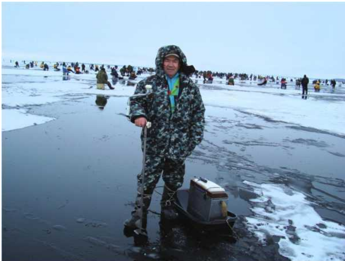
Ладога, Леднево. Декабрь 2008 года.