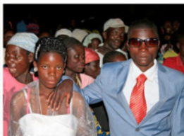
Совет да любовь!