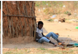
Скоро приедут молодожены: все ждет с нетерпением. Местный поэт.