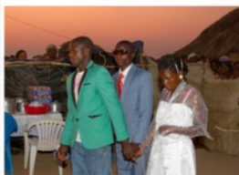
Едва солнце спряталось за горизонт, настало время садиться за праздничный стол.