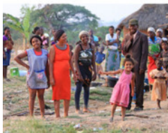
- Едут! Едут!