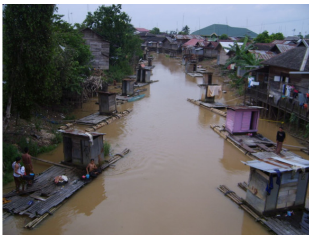
Деревенские туалеты, они же душ – постирочная, на реке на Калимантане

Сельские туалеты выглядят очень просто, как и у нас.