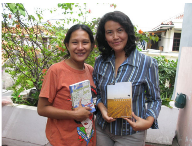
Индонезийские путешественницы, авторы книг о путешествиях

Есть книги о путешествиях и для путешественников, изданные в Индонезии. Среди 250 миллионов индонезийцев есть несколько тысяч людей, кому это интересно. Печатаются и книги по этой тематике. «Объехать Тайланд, Малайзию и Сингапур за 3 миллиона рупий ($250)», «Путешествия по Европе – шесть месяцев за 1000 долларов», «Автостопом по Европе – по 500 тыс. рупий в месяц», «Откройте для себя Малайзию, всего за 1 миллион рупий», и прочие книги встречаются в основных книжных и занимают особую полку. На индонезийском, конечно же, языке. Был выпущен и путеводитель по России для индонезийцев, но описаны там только Москва и Петербург.