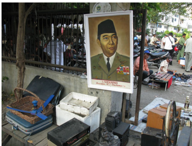
Портрет Сукарно, на барахолке с другими малоценными товарами

Президент Сукарно был типа Ленина, а в должности он был примерно двадцать лет. Он основал государство, помнил, что капитализм – это нехорошо, имел некоторую склонность к коммунизму, пытался налаживать дружбу с СССР, мусульманских партий опасался, а с Хрущёвым дружил – и его судьбу повторил.