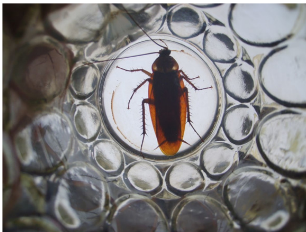
Большой таракан, в диаметр стакана

Некоторых также может привлечь просто пот. Мойтесь два раза в день, а если уронили что сладкое на одежду – немедленно простирните. Если у вас при себе вкусности и фрукты – на ночь не кладите в рюкзак и в палатку, а держите в стороне или подвесьте, на верёвку, сучок, гвоздик. Если там, где вы обитаете, есть холодильник – прячьте туда сладости, фрукты, сахар и хлеб. Если вы путешествуете по стране, не таскайте с собой запаса вкусных продуктов – всё открытое нужно съесть сегодня. Иначе завтра это будет или муравейник, или тухлятина. Исключение только для фабричных упаковок – неоткрытые шоколадки, варенье, сахар в фабричных упаковках – насекомонепроницаемы.