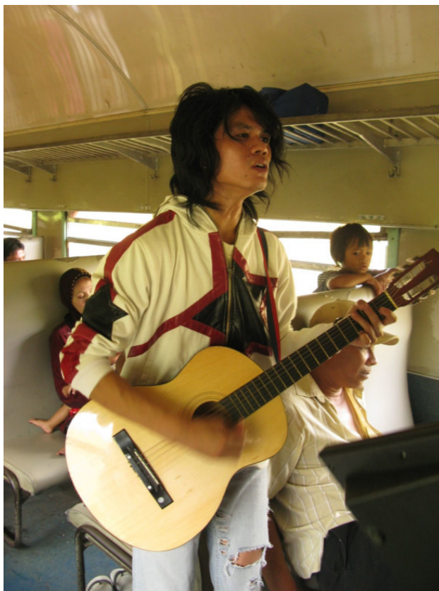
Музыкант в электричке (пригородном поезде)

хия (на иностранцев не влияет). Наверное, на Яве – Джокьякарта самый тусовочно-музыкальный город, где можно играть на улице Малиоборо; можно попробовать в центре Джакарты или Сурабайи, Соло или Семаранг на крайняк.