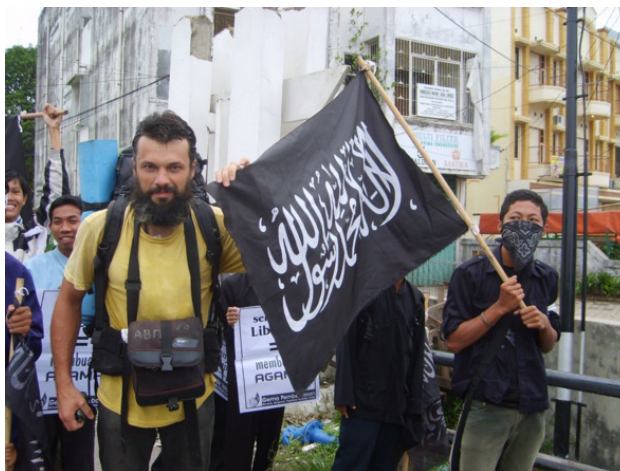
Мирная демонстрация в защиту ислама и Пророка