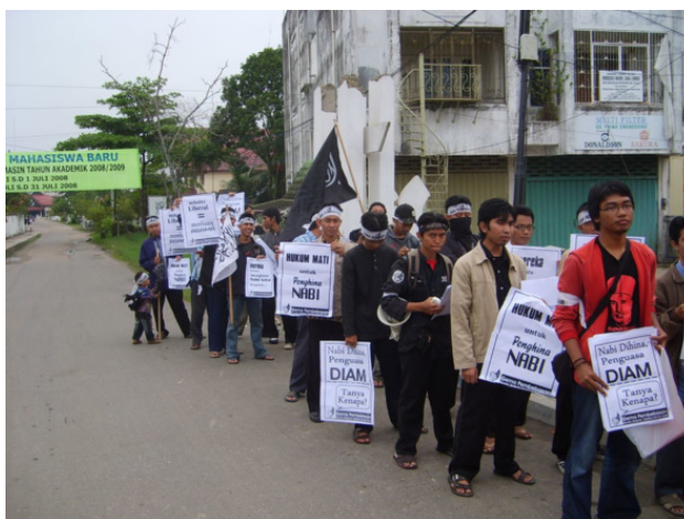
Мирная мусульманская демонстрация. Индонезия

А вот на Папуа бывают шествия, митинги и демонстрации папуасских сепаратистов, которые стараются отделить себя от Индонезии – с этими шествиями лучше не связываться. Когда услышите от папуасов лозунги «Папуа мердека» (свободу Папуа!), лучше из этого места уйти, может кончиться побоищем с полицией, вас тоже могут задержать, как подстрекателя или соучастника антигосударственного шествия.