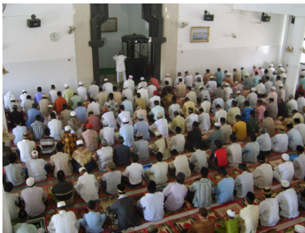
Начинается коллективная молитва в мечети

97% мечетей не имеют никакой «священной» торговли даже рядом: считается, что и чётки, и тубетейки у всех уже имеются. Но иногда, за воротами самых крупных и известных мечетей порой можно приобрести финики, Кораны, книги о благочестивой жизни, история «Вали сонго» – святых мужей, распространивших ислам по Яве, детские прописи «Арабский для начинающих», книжки «Икра́» (не удивляйтесь, это не красная икра, и Iqra, книга для обучения чтению арабского), благовонные духи и тубетейки.