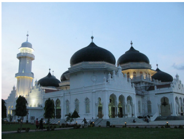
Мечеть, вид снаружи

Мечети предназначены для верующих-мусульман, чтобы мы там совершали поклонение Всевышнему. Кроме поклонения, есть и другие функции. У мечети есть краны, кранами может воспользоваться любой человек. Мечеть – центр общения местных жителей, типа деревенского или районного клуба, место произнесения проповеди, место, куда несут деньги – пожертвования, и где могут оказать помощь обедневшему, нуждающемуся.