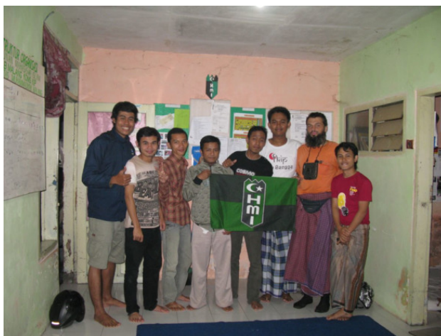
Тусовка индонезийских студентов

Встречи турклубов, или других местных путешественников. Бывают вечером по воскресеньям, в самых известных городах.