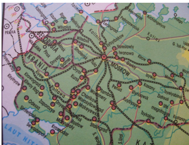
Карта России из индонезийского атласа

Карты других стран у них тоже показаны с ошибками.