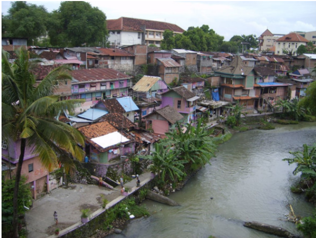
Город в Индонезии

Как правило, каждая улочка имеет один основной вход с большой улицы города, и этот вход закрывается шлагбаумом, или какой-то символической калиткой. Днём обычно всё открыто. Ночью, например с 23:00 до 4:00 утра, некоторые кварталчики или улочки закрываются, их охраняют сторожа, во избежание проникновения посторонних людей или грабителей. Но пешеход всегда может пройти, шлагбаум затрудняет только проезд «оптовых» ночных грабителей на своём транспорте! На своих ногах – можно.