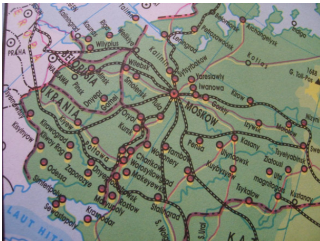
Карта России из индонезийского атласа