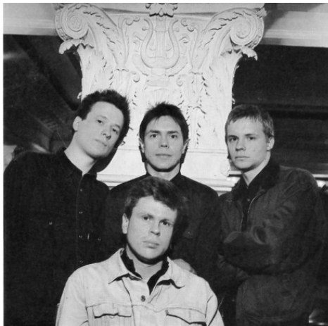
«ЦЕНТР», 1988 год фото с миньона фирмы «Мелодия»