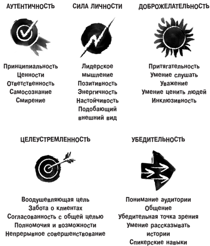
Рис. 2.1. Качества и навыки харизматичного лидера