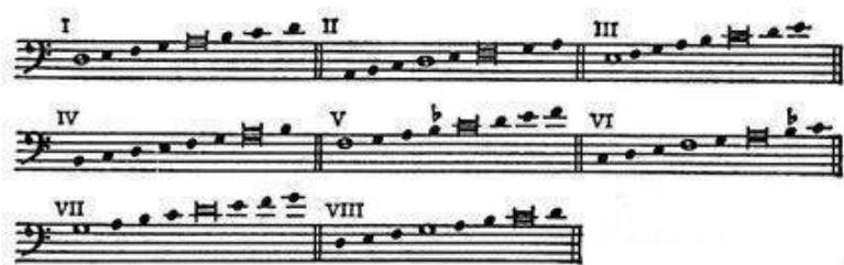
Пример № 2.

Продолжается развитие античного учения об этосе, и если в раннем средневековье акцент делается на очистительном, катарсическом факторе, то впоследствии эмоциональная палитра музыки начинает расширяться. Все восемь «церковных» ладов (гексахордные (от лат. «hexachordum» – «шестиструнный») аналоги Античности) обладали определенным моральным и эстетическим значением и могли в равной мере успешно применяться, исходя из тех или иных обстоятельств. К примеру, печальному и несчастному человеку надлежало обратиться к фригийскому (второму) ладу, лидийский (третий) лад символизировал бодрость и здоровье, а гиподиксолидийский (восьмой) лад, размеренный и возвышенный, предназначался мудрым старцам [62].