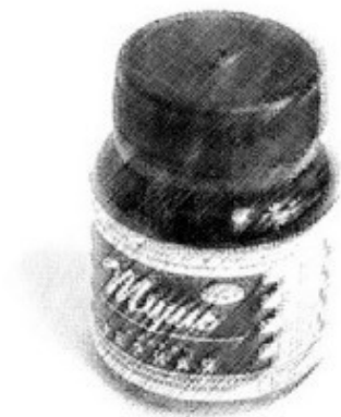
Рис. Крюковой Светланы

Через 10 минут все снова собрались в комнате. Мама предложила осмотреться и найти, что кроме рисунков изменилось здесь за ночь.