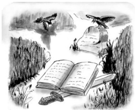
Рис. Елены Бондаревой

– Я только во сне предсказания делаю, – ответила Мудрена, – иди в лес за сон-травой, сплю я плохо, ходит чародей с книжками какой-то поблизости, чары его мне спать мешают.