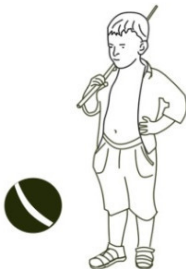
Рис. Светланы Шаталовой

Но Пашка долго злиться, а Мячик прятаться не любит. Как только срок наказания заканчивается, они с Пашкой снова вместе собираются и гулять идут.