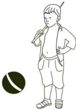
Рис. Светланы Шаталовой

Вот катится как-то Мячик по дорожке перед Пашкой и думает: «В доме и во дворе я все закоулки знаю, все стекла переслушал, всё варенье перепробовал. А что там, за забором?»