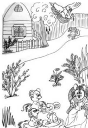
Рис. Людмилы Лесной

Они летели над лесами и полями, горами и болотами. Казалось, что этот полет не закончится никогда. Мышка прощалась с жизнью. Слезы горошинками катились с глаз, она мысленно прощалась со своей мамой-мышью, с братишками-мышатами, а также с любимой Тетушкой Крысой. Она знала, что больше никогда их не увидит.