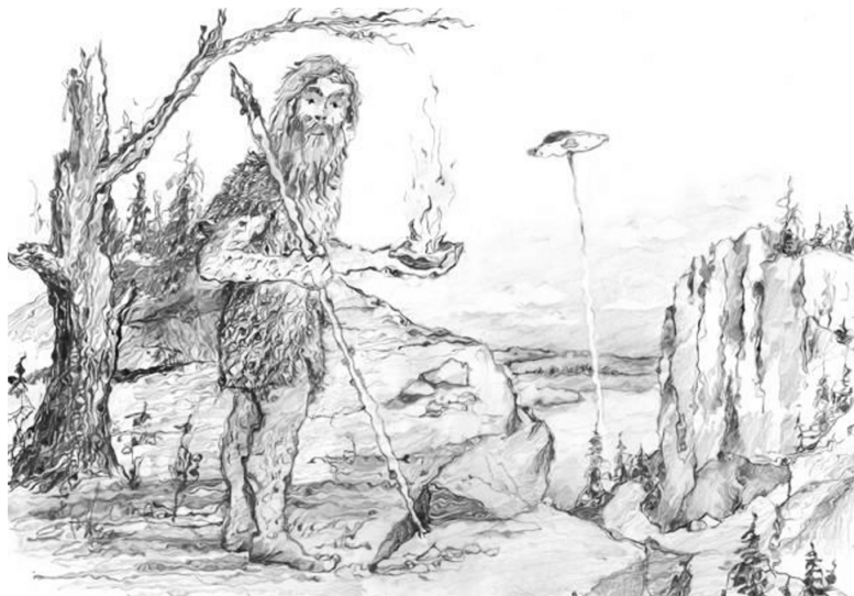
рис. Нурпеисова О.С.

В чем была суть? Они привезли огонь Божий – воронка, а из нее вылетал огонь, как из бензореза. Так вот, они сказали, чтобы пользовались огнем и жарили на костре мясо. Разожгли костер, огонь воткнули в трещину камня, предупредили о пожаре. Сели в круглый огонь и улетели. После этого онемение тела прошло. В нашем племени появился огонь.