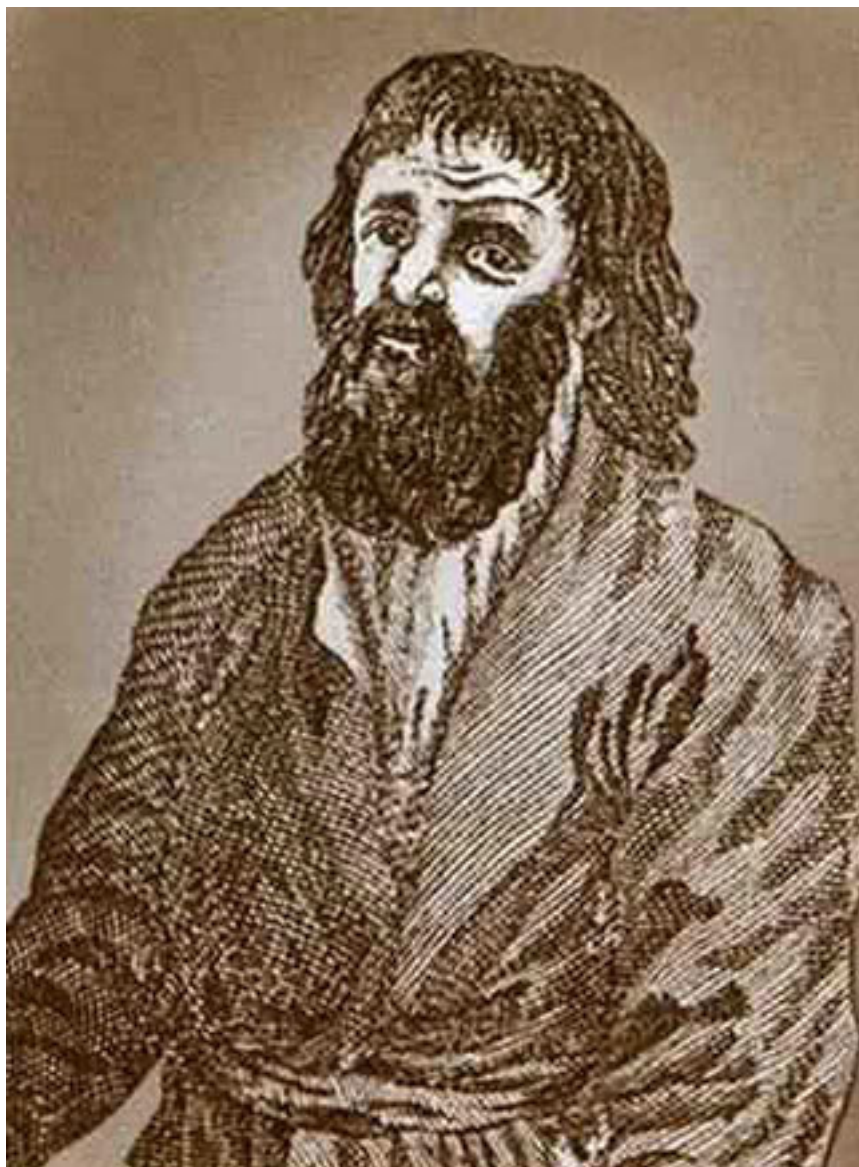
Рис. 3. Портрет Ваньки Каина из книги XVIII века

Однако в штат Ваньку не взяли. И он, ничего не зная про Джонатана Уайльда, пошел по его стопам. С 1741 по 1748 год «доноситель и сыщик» Ванька Каин выдал 774 преступника, однако тех, кто платил ему дань, он не трогал. Подобно лондонскому предшественнику, Каин занимался и «розыском» похищенных вещей. Однако за возврат украденного выставял столь безбожный счет, что «ограбленные чувствовали себя ограбленными дважды». В отличие от лондонского «короля вороловов», Ванька Каин и сам принимал участие в преступлениях. Так, в 1748 году он организовал одно из самых успешных разбойных нападений XVIII века в Москве, напав на струг 2 купца Степана Скачкова, шайка под его руководством похитила более тысячи рублей.