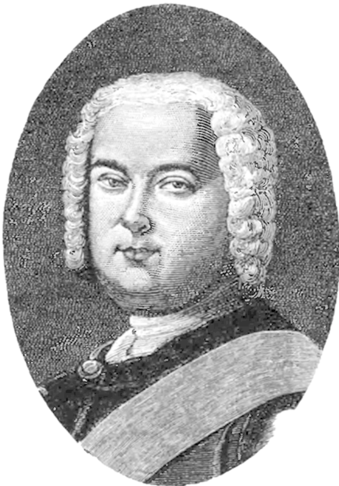
Рис. 2. Генерал-полицмейстер Санкт-Петербурга А.Д. Татищев

На посту генерал-полицмейстера империи Алексею Даниловичу Татищеву удалось пресечь деятельность известного всей Москве Ваньки Каина.