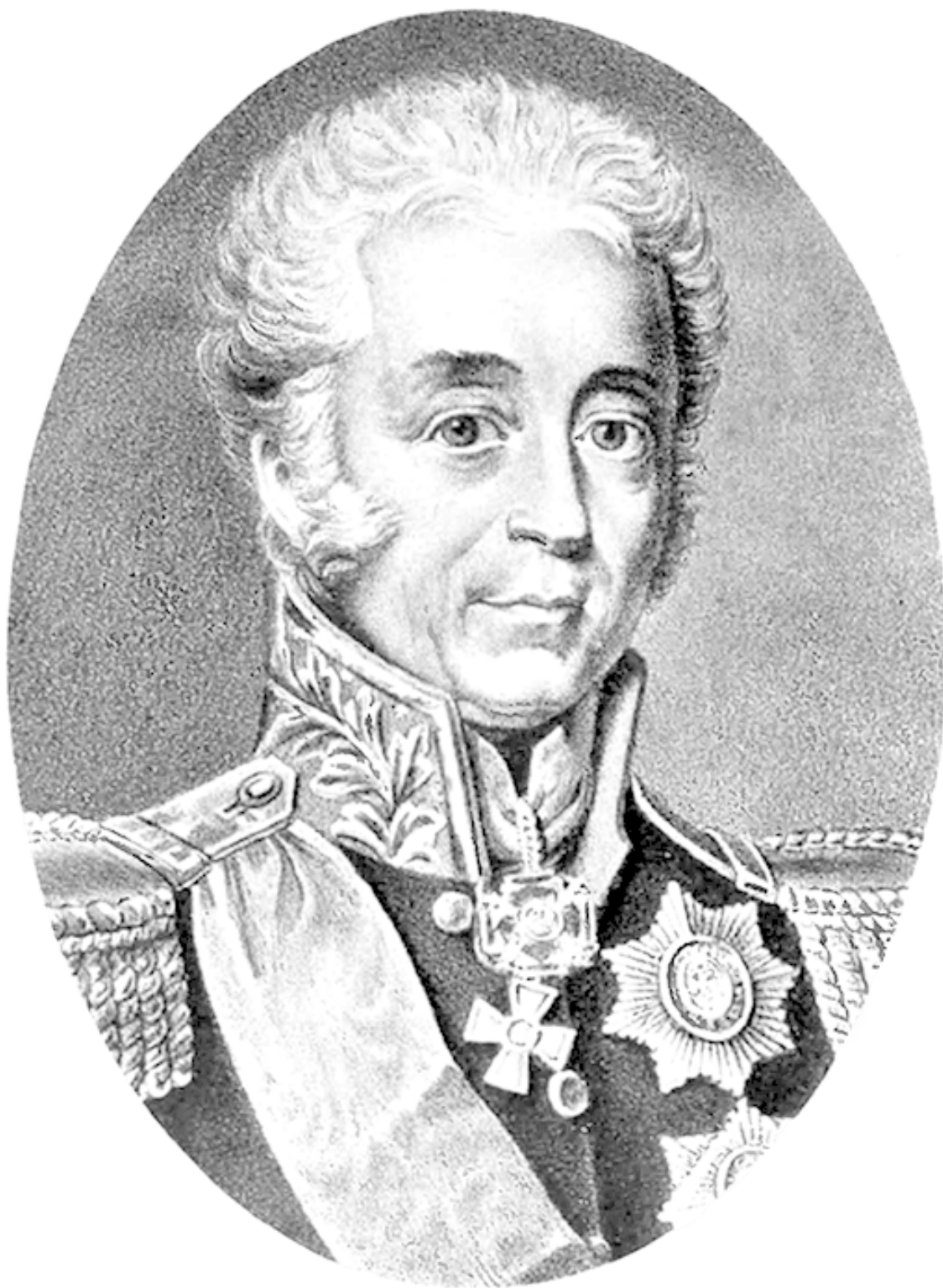
Рис. 5. Санкт-Петербургский военный губернатор Д.И. Лобанов-Ростовский

Свое представление он мотивировал тем, что