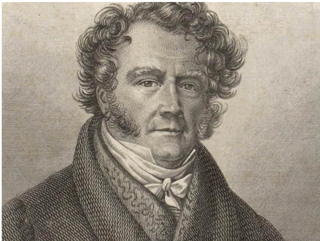
Рис. 4. Эжен-Франсуа Видок. Портрет из издания его мемуаров 1829 года

энергично: так, за 1817 год Видок с подчиненными произвели семьсот семьдесят два ареста и тридцать девять обысков с захватом украденных вещей.