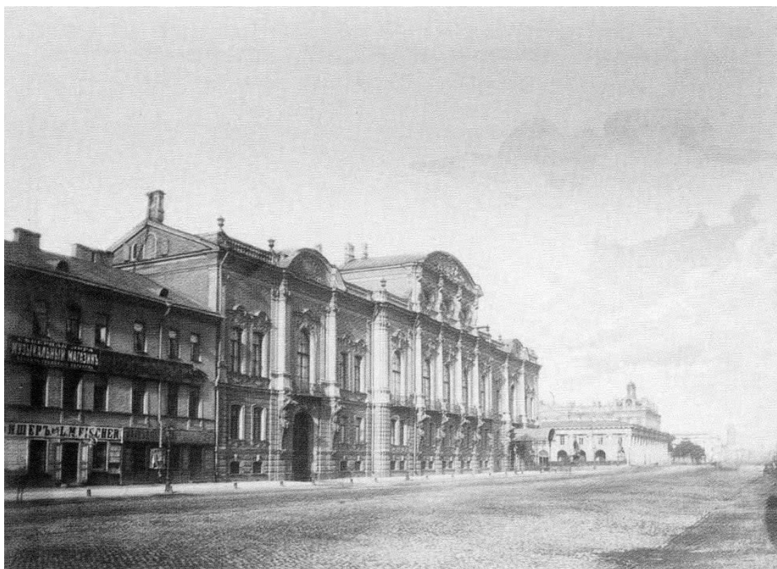
Рис. 11. Дом Дидло (крайний слева), фотография XIX века