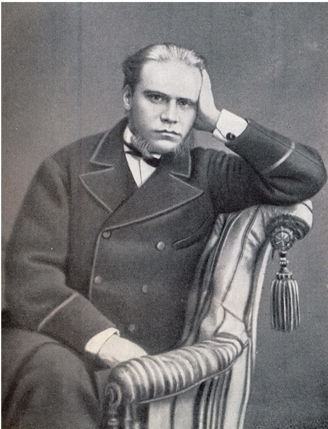
Рис. 12. Анатолий Федорович Кони, фотография 70-х годов XIX века