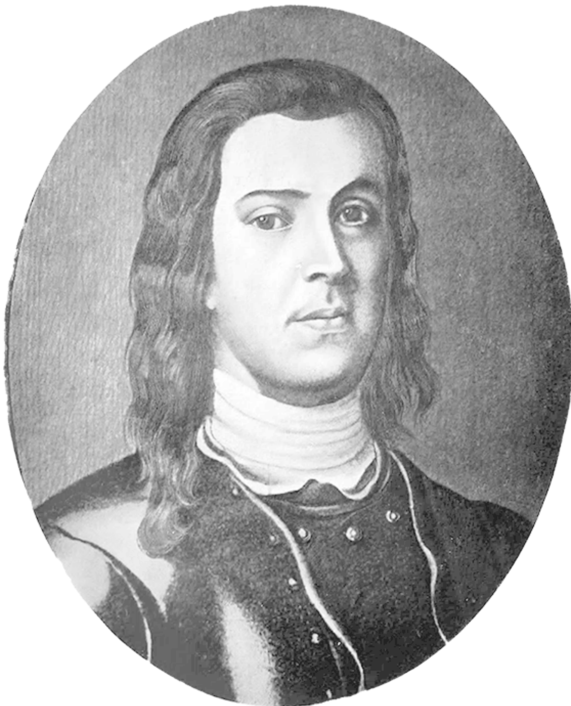
Рис. 1. Первый генерал-полицмейстер Санкт-Петербурга А.М. Дивьер

Причиной вражды стала женитьба Дивьера на сестре Меншикова Анне Даниловне. Светлейший был категорически против брака – слишком уж низким, по его мнению, было происхождение (из каталонских евреев) первого генерал-полицмейстера Петербурга. Но вмешался Петр I, и свадьба состоялась. Однако Меншиков с семейным позором не смирился. Случай отомстить выдался, когда Екатерина I была при смерти и уже плохо соображала. Александр Данилович оговорил ей Дивьера, мол, весь двор в печали, а он – нет. Несчастного вздернули на дыбу, после двадцать пятого удара кнутом он сознался, что готовит антиправительственный заговор. За несколько часов до смерти Екатерина I подписала указ о ссылке Дивьера в Якутию.