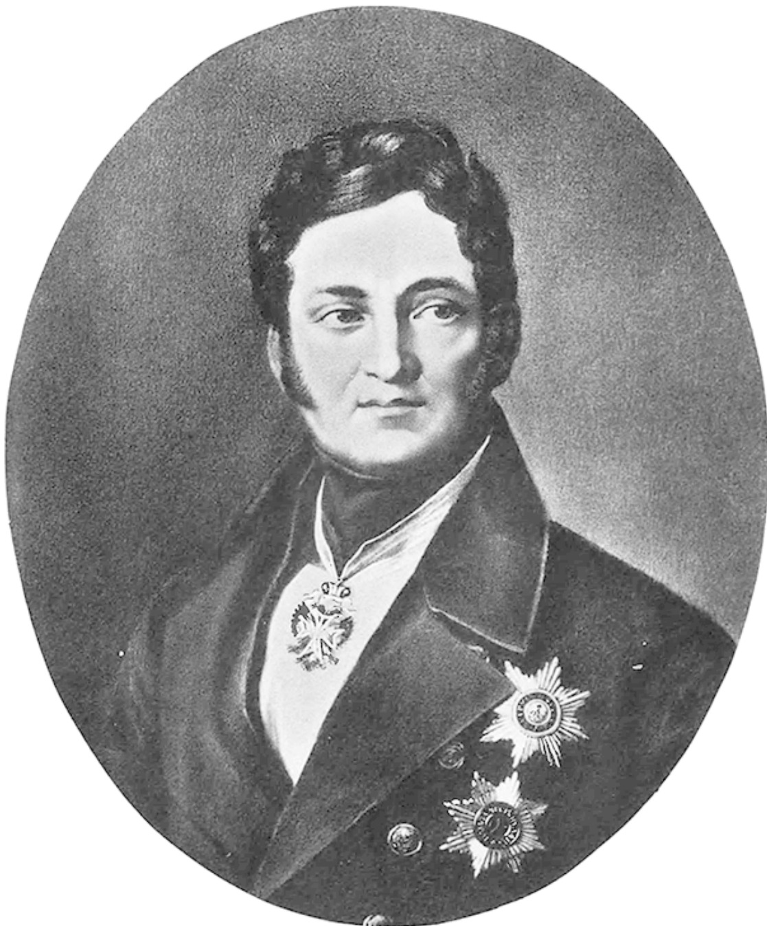
Рис. 8. Лев Алексеевич Перовский

В сентябре 1841 года министром внутренних дел Российской империи стал Лев Алексеевич Перовский (1792–1856). Это назначение было воспринято современниками «как знаменательное событие в общественно-политической жизни, как признак серьезных перемен в России» [30] , потому что Льва Перовского знали как человека твердого, целеустремленного, смелого и, что самое важное, убежденного сторонника отмены крепостного права. В юности, как и И.П. Липранди, Лев Перовский состоял в Союзе Благоденствия, однако идею о свержении монархии не разделял и в восстании на Сенатской не участвовал. Отличаясь редкой работоспособностью и энергичностью, Л.А. Перовский пытался привлечь к работе в Министерстве чиновников, обладавших теми же качествами: так, для управления личной канцелярией он пригласил успешного проявить себя талантливым администратором Владимира Ивановича Даля, составителя знаменитого словаря. Граф Павел Дмитриевич Киселев (1778–1872), занимавший тогда