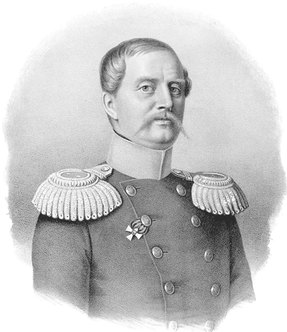
Рис. 9. Обер-полицмейстер Санкт-Петербурга А.П. Галахов

не могли. И тогда обер-полицмейстер Александр Павлович Галахов велел позвать Шерстобитова.