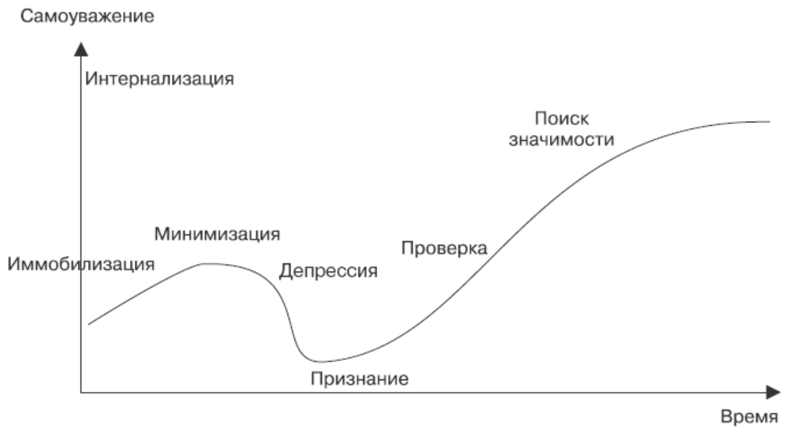
Рис. 1.2. Кривая самоуважения

Поскольку прогресс каждой личности уникален, то кто-то никогда не сможет пройти через иммобилизацию или минимизацию, кто-то может не справиться с депрессией, а многие пройдут поэтапно все ступени.