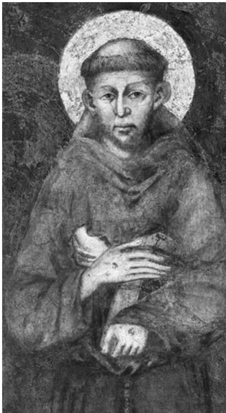
Святой Франциск Ассизский Фреска работы Джотто ди Бондоне

Тающая синева небес, тонкая очерченность холмов, пушистость раннего цветения на картинах Рафаэля, Перуджино, Пьеро делла Франческа. Весь настрой нежной, молодой, однако и твердой, таинственной земли Тосканы способствовал деятельному поэтическому гению этих мест. Тогда, на рубеже XII–XIII веков, возникла мода на любовную и религиозную песенную лирику странствующих бардов, менестрелей и жонглеров из Франции. Странствовали группы и балаганы в праздники и ярмарочные дни. Но особенно популярны были жонглеры, которые умели все: и петь, и ходить на руках, и быть или казаться чуть-чуть юродивыми. Легенду о «Жонглере Богоматери» знали все. Молодой человек не знал ни молитв, ни грамоты, но страстно, всем сердцем возлюбил Пречистую Деву. Свое служение он доказывал, выделявая антраша, исполняя песни-молитвы собственного сочинения. Однажды во сне Пречистая явилась ему и в знак благосклонности укрыла сына своего покрывалом, обласкала улыбкой, сия-