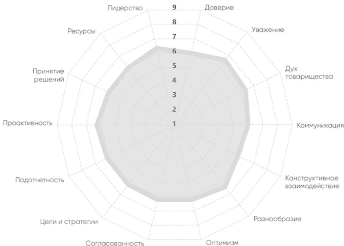
РИС. 3. Средние баллы для более чем 3000 команд за 2008–2017 гг. из базы данных TCI Team Diagnostic

В главах 2 и 3 мы сделаем более детальное сравнение высокоэффективных и низкоэффективных команд, однако даже по этой простой диаграмме усредненных данных видно, насколько велико пространство для развития, которое может заметно улучшить показатели организации.