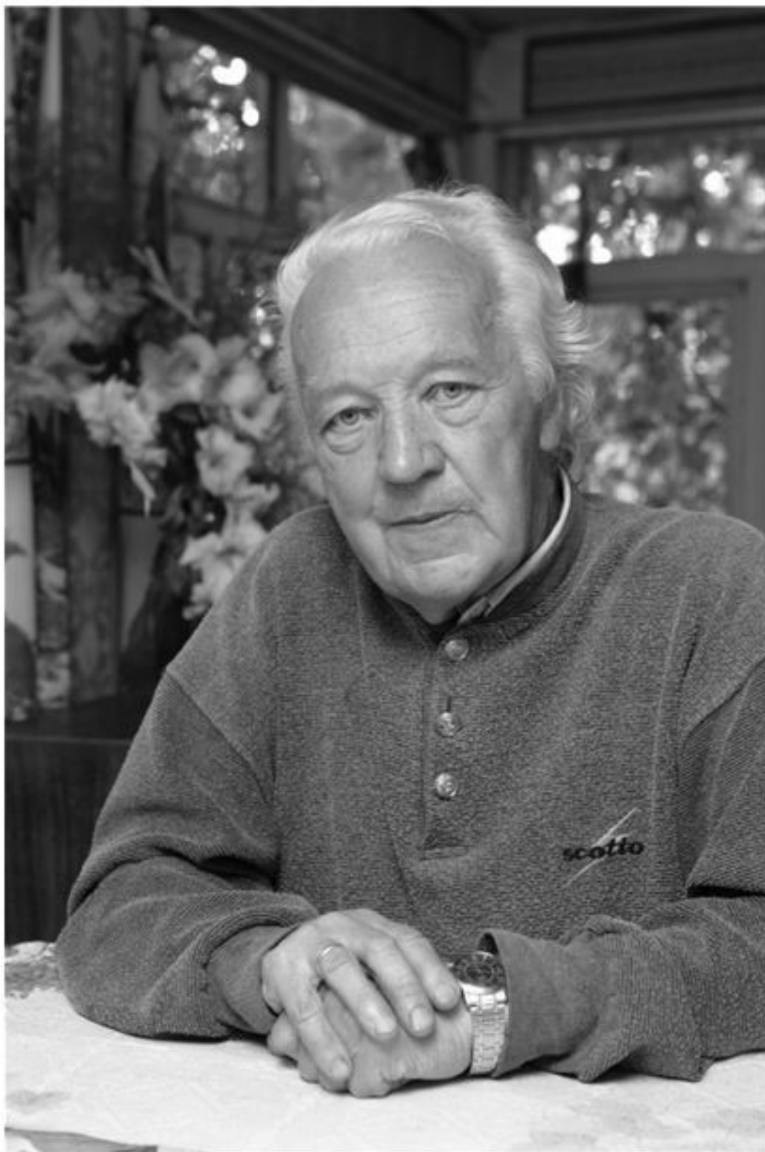
Адольф Константинович Павлов