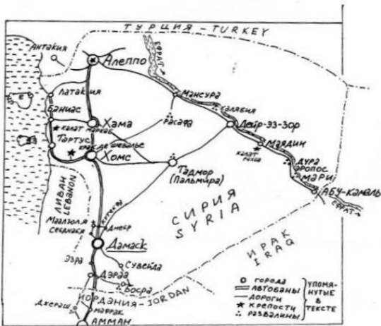
Схема наших поездок по Сирии

Пока мы высматривали нормальную машину, чтобы отвезла нас парасыз, точнее маджанан, – вокруг нас собрались любопытные местные жители.