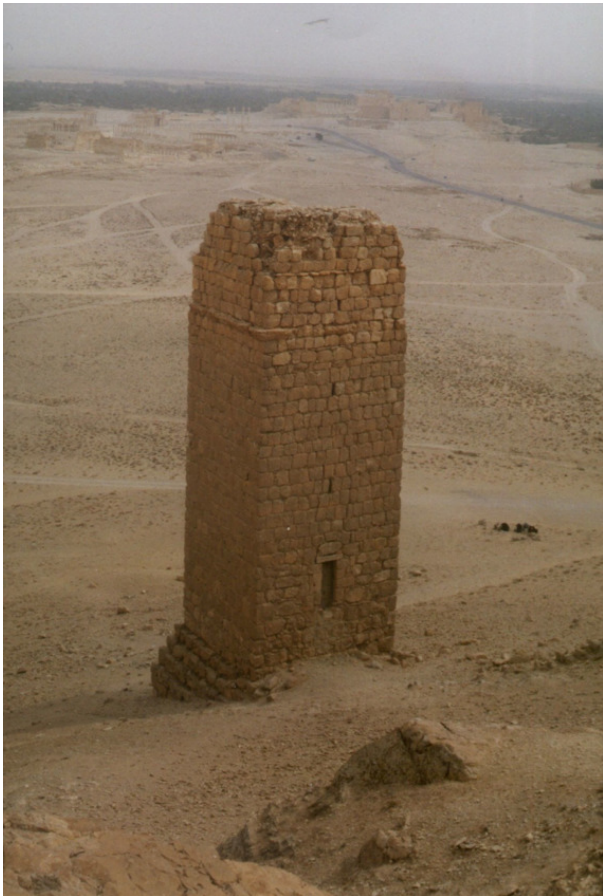
Погребальная башня в Пальмире. Конец XX века (сейчас, вероятно, от неё ничего не осталось)