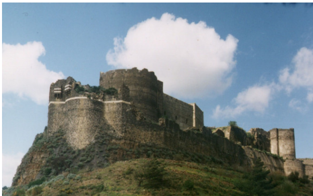
Калаат Маркаб. Февраль 1999

Сейчас мы направлялись в другую супер-крепость, носящую имя Калаат Маркаб. Эта крепость находилась в стороне от трассы – от дороги до неё было километров шесть, – но она была хорошо видна издали, ибо, как и Крак де Шевалье, венчала собой гору.