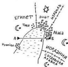
Схема взаимного расположения Египта, Иордании, Израиля и Саудовской Аравии в Акабском заливе

ны иные, нетрадиционные способы перемещения.