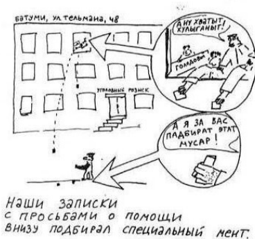
Схема разбрасывания наших записок из здания Уголовного Розыска города Батуми

нам казалось, они попадали в руки и честным гражданам; кое-кто из них всё-таки позвонил моим родителям в Москву, спасибо!