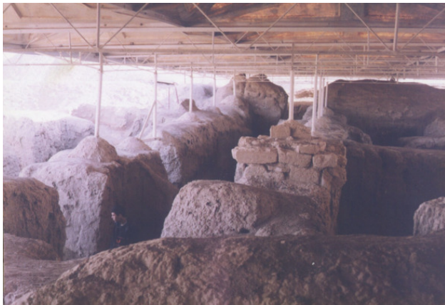
Развалины Мари. 1999

Утром, как только мы приблизились к развалинам Мари, навстречу из какой-то хибары вылез билетёр. Стоимость входного билета мы так и не узнали – две бумажки, с надписью «1 билет МММ» на каждой, стали ему утешением; и довольный билетёр пропустил нас.