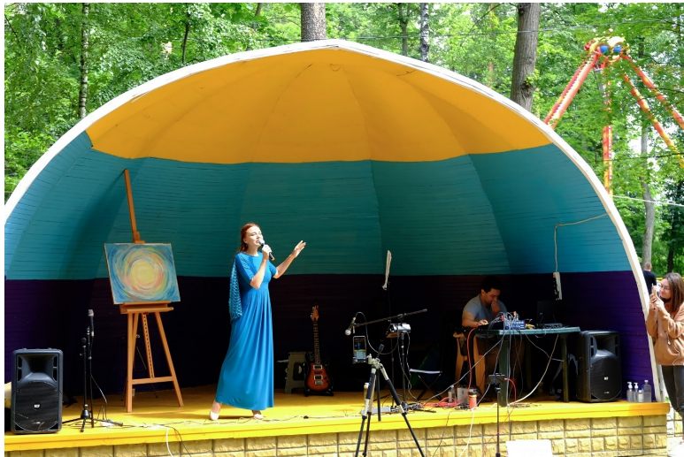
На фото: кадр из спектакля в стихах «Магия слов»