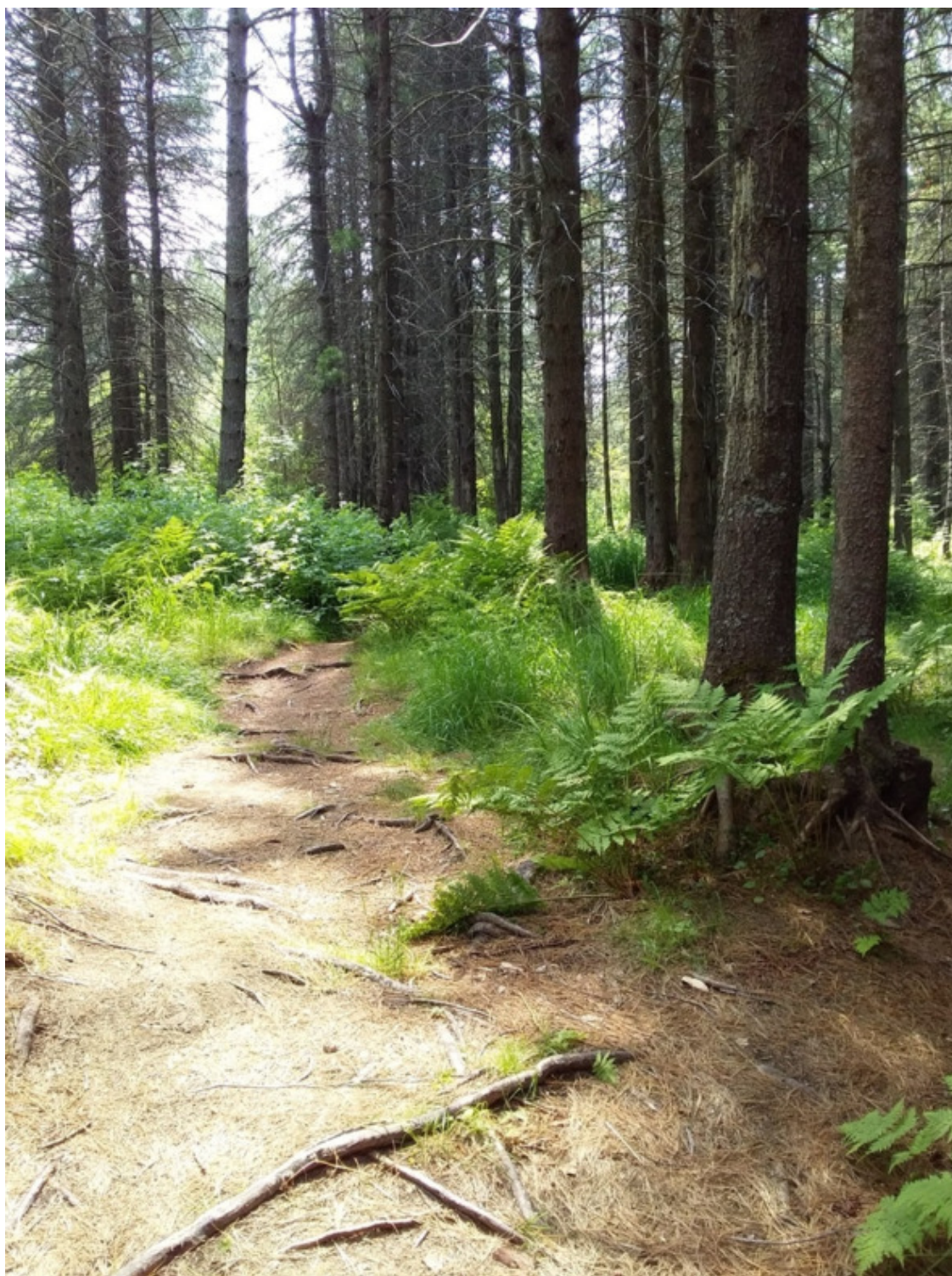
Байкальский биосферный заповедник