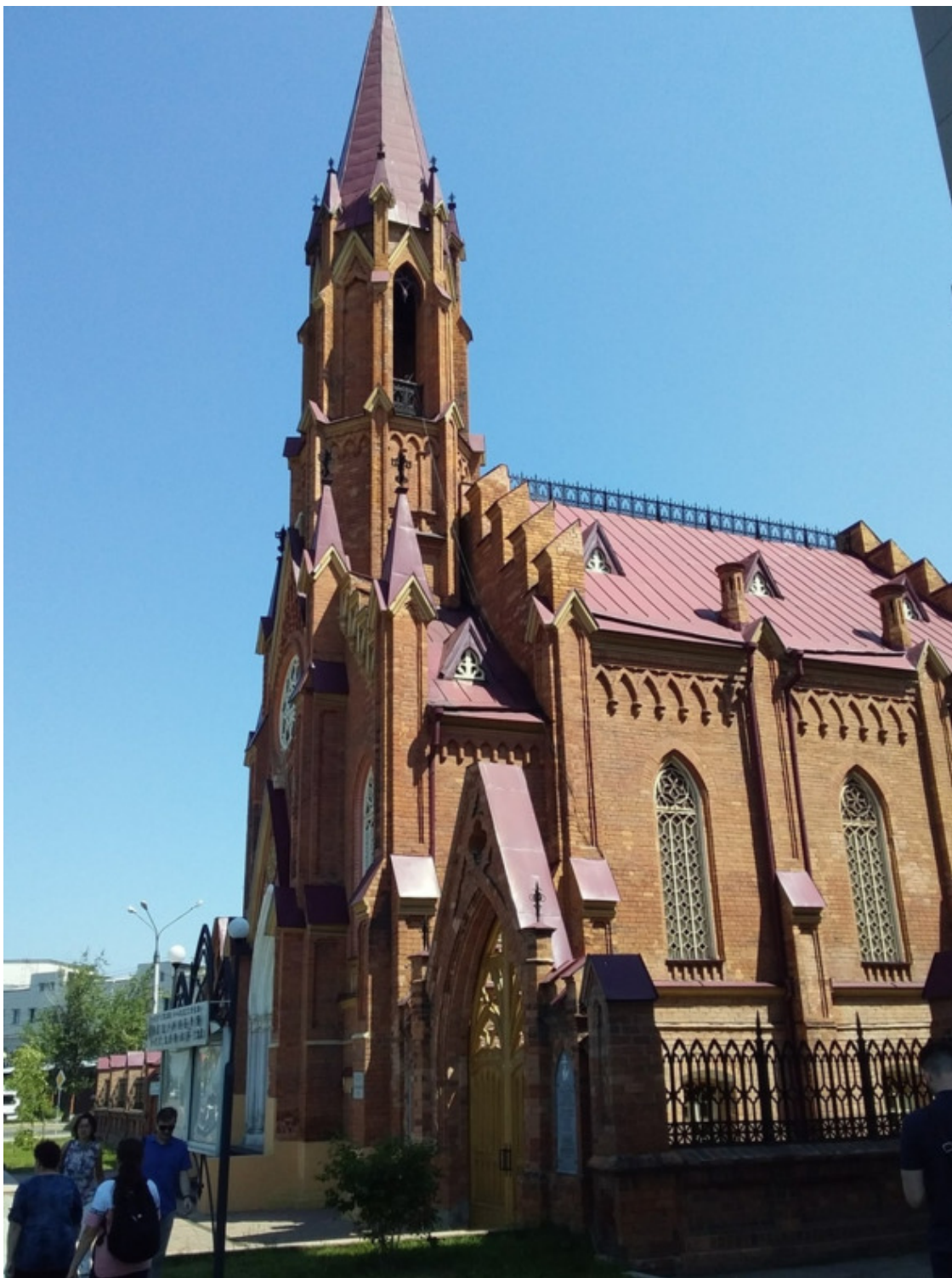
Католический костел в Иркутске.