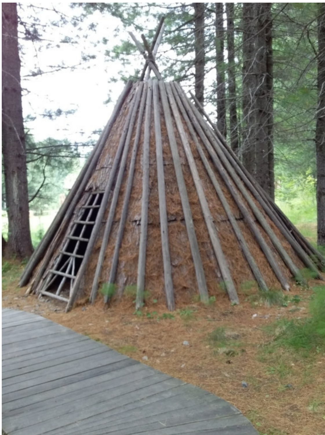
Байкальский биосферный заповедник. Юрта.