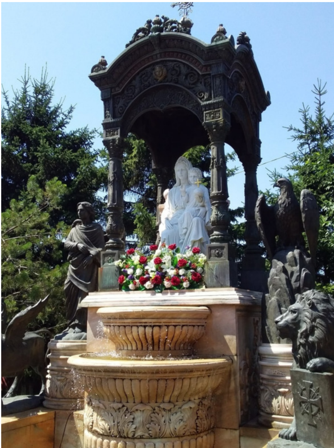
На территории Казанской церкви в Иркутске.

Приезжаем в Байкальск только под вечер, размещаемся и отдыхаем. А вечером нас ждет настоящий сюрприз – дегустация блюд из байкальского омуля.