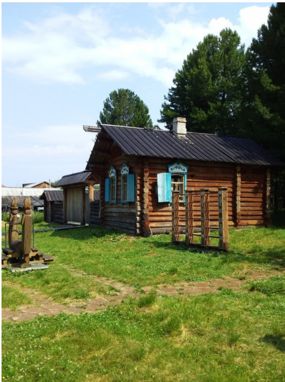
У входа в заповедник.