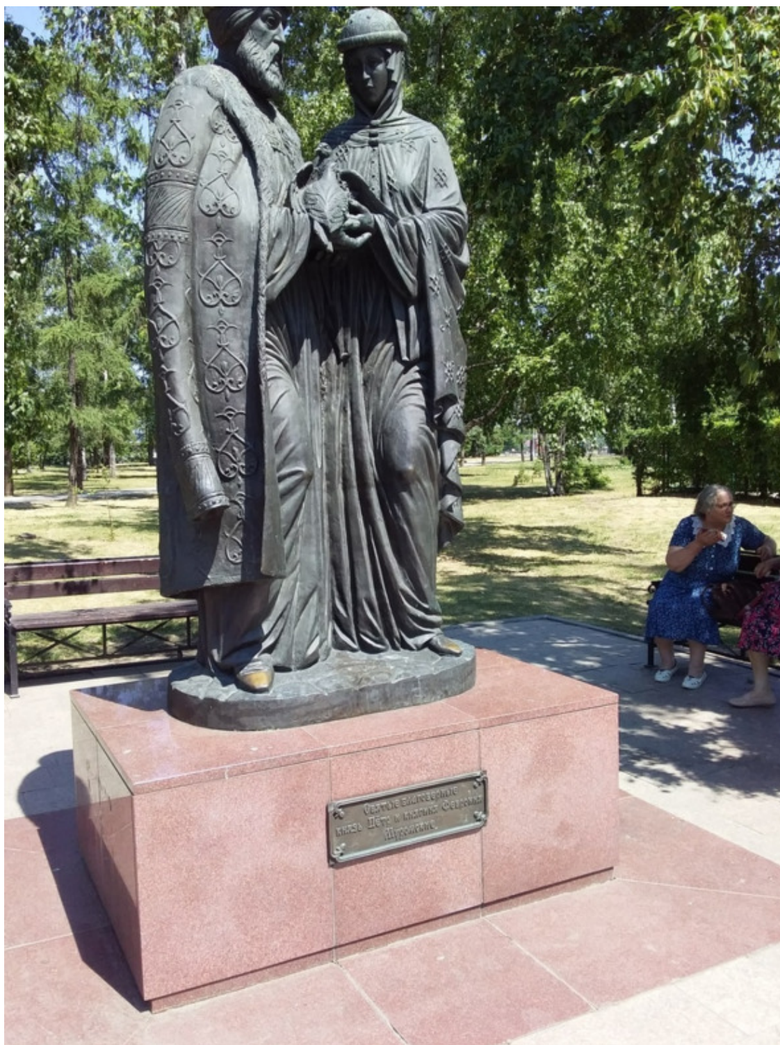
Памятник Петру и Февронии в Иркутске.