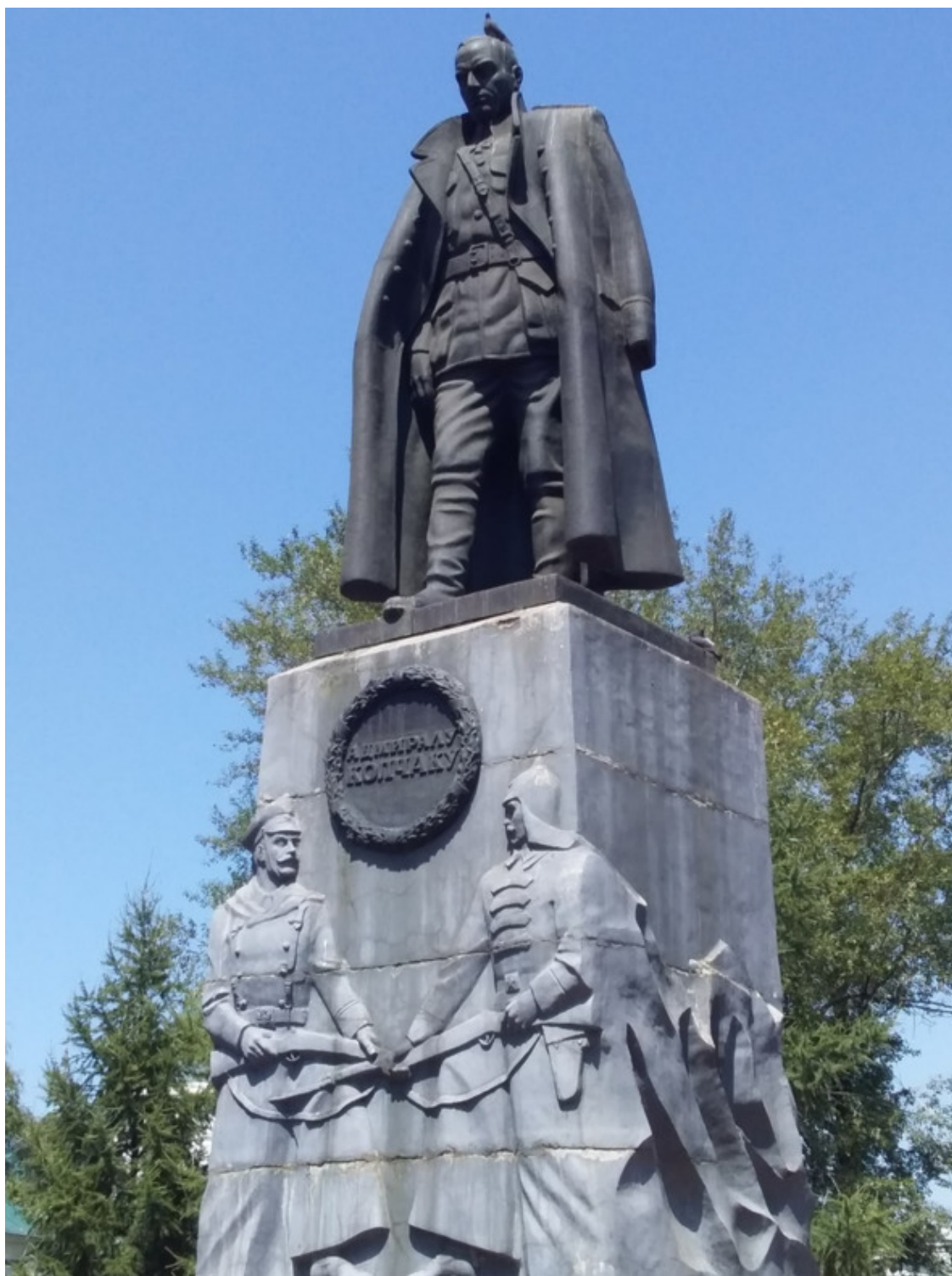
Памятник адмиралу Колчаку в Иркутске.