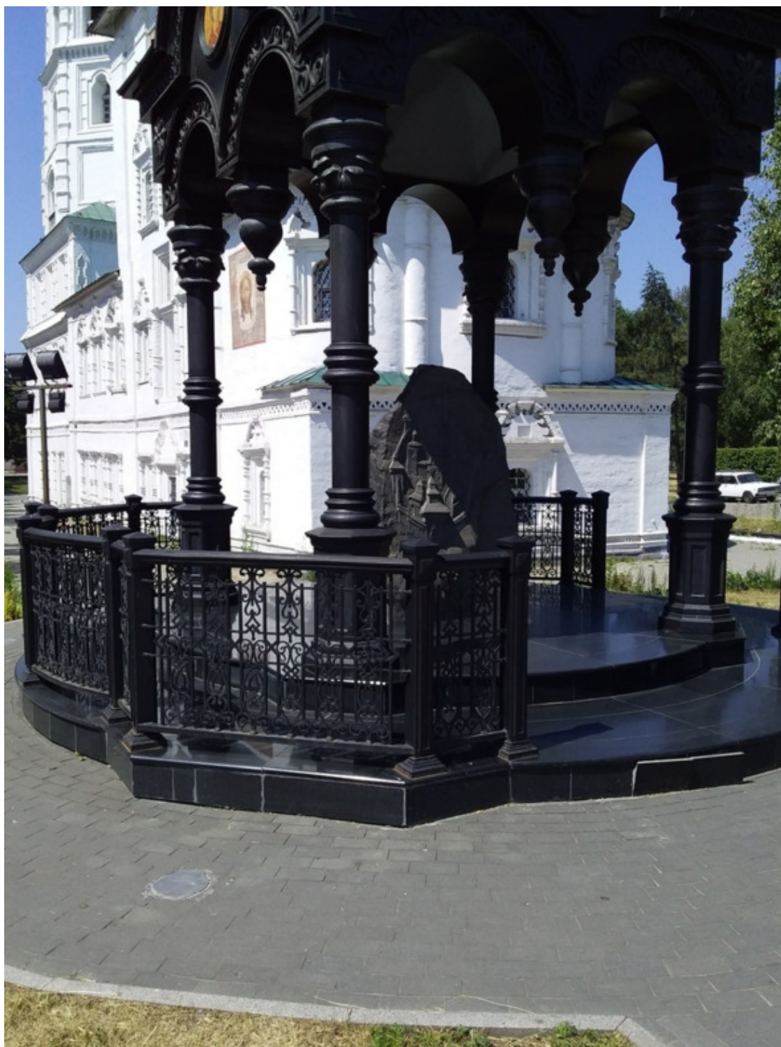
У входа в храм Спаса Нерукотворного (Иркутск).