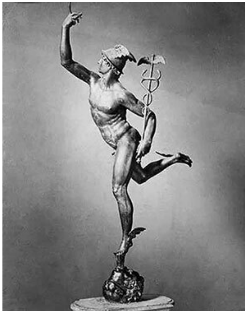
Джамболонья; Меркурий, 1564 г.

В то лето, когда мне исполнилось шестнадцать, а мир, казалось, мог уместиться в моих ладонях, я вдруг обнаружил, что под моим районом в городе Провиденс, штат Род-Айленд, проходит заброшенный железнодорожный туннель. Я узнал о его существовании от школьного учителя естествознания – невысокого усатого человечка по фамилии Оттер 2 , который знал, где находится каждая невидимая для глаз рытвина в Новой Англии. Он рассказал мне, что туннель когда-то использовался для обслуживания небольшой грузовой линии, но с тех пор прошло много лет. В наши дни он превратился в развалины – грязные, затхлые, забытые; теперь там копился всевозможный мусор.