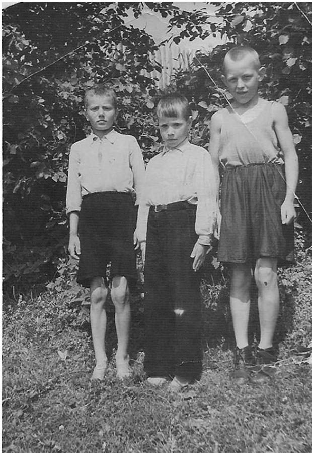
С друзьями детства, 1950-е