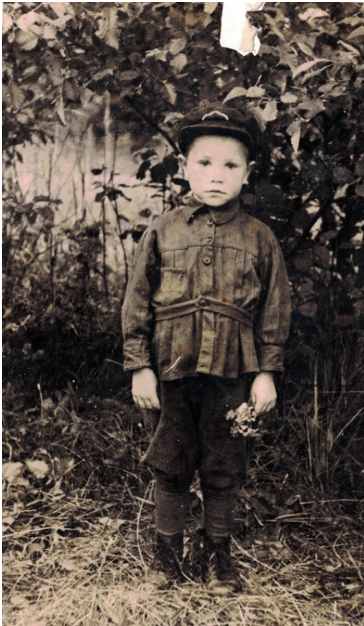
Перед первым классом, Комарово, 1950