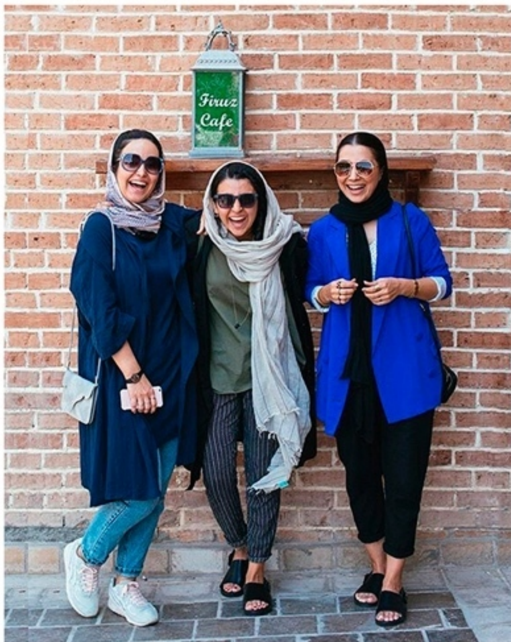
Как одеваются современные иранки.

Появление на улице без хиджаба очень быстро закончится беседой с полицией. Помните, что намеренный отказ соблюдать хиджаб с точки зрения законодательства Исламской Республики Иран является преступлением и карается штрафом, а то и тюремным заключением (туристку в этом случае попросту досрочно вышлют на родину). Впрочем, некоторая небрежность или ненамеренная забывчивость ничем вам не грозит. В крупных городах можно позволить себе определенные вольности в одежде, но вот в провинции лучше носить что-то подлин-