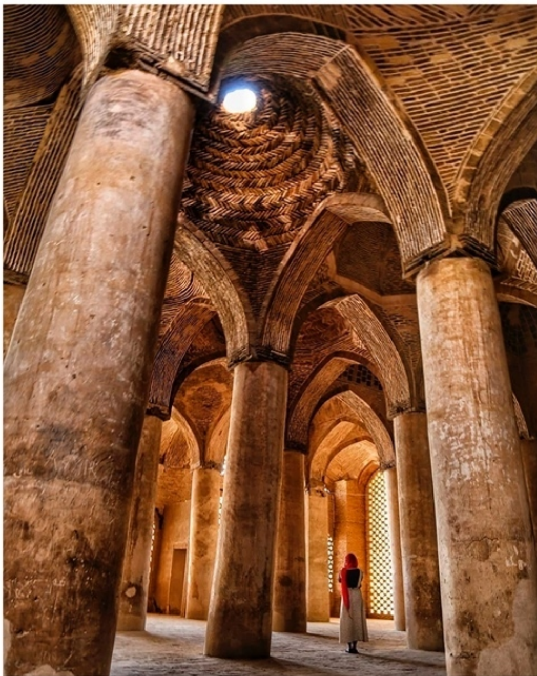
Мечеть Джаме (Месджеде-Джаме) г. Исфахан

В отличие от построенных в едином стиле всего за несколько десятков лет зданий на Нагше-Джахан, эта мечеть строилась и перестраивалась с XI по XVIII в. и в ней сохранились следы всех этих эпох. Считается, что самая первая мечеть появилась тут еще в VIII в., хотя теперь от нее ничего не осталось. Зато здесь можно увидеть стены, украшения, купола, залы, созданные при Буидах, Сельджуках, Ильханидах, Тимуридах и, разумеется, Сефевидях, и, как