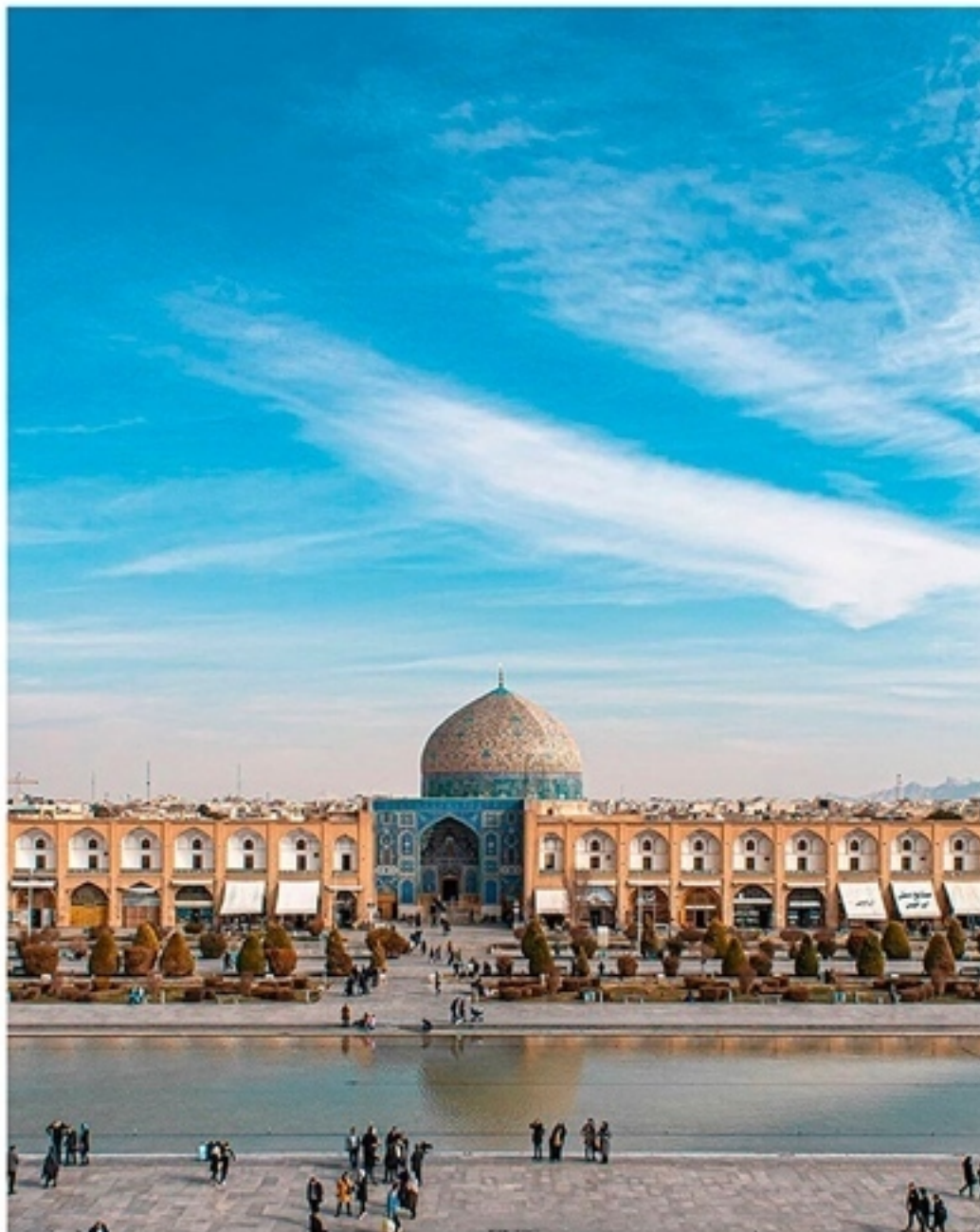
Площадь Нагше-Джахан (площадь Имама) г. Исфахан

Открыто: ежедневно 7.00-23.00 (закрывается на молитву по пятницам в первой половине дня) с улицы Сепа, с ее западной стороны. Площадь, которую после Исламской революции официально переименовали в честь Аятоллы Хомейни, является самой крупной в мире после китайской Тяньаньмынь – ее размеры составляют 510 x 163 м. Неудивительно, что когда-то здесь играли в «чоуган» (по сути, в поло, которое потом из Ирана пришло в Индию и оттуда – к англичанам) и устраивали скачки. Площадь в центре города, на месте садов Нагше-Джа-