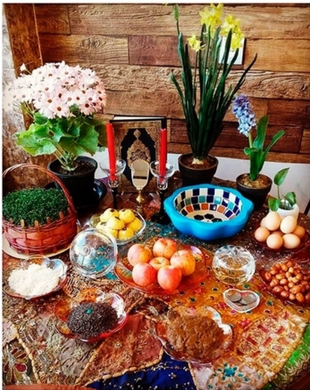
Хафт син - накрытый скатертью стол, на котором расставлены традиционные предметы для празднования Навруза (персидского Нового Года).

«Син» – буква персидского алфавита, с которой начинаются названия семи предметов (по большей части съедобных), обязательных для встречи Нового года. Набор вещей может варьироваться, но в целом хафт-син в городских квартирах нынешних персов мало чем отличается от роскошного стола, который 2000 лет тому назад утром Нового года слуги вносили в покои персидского царя. Давайте перечислим волшебные символы: