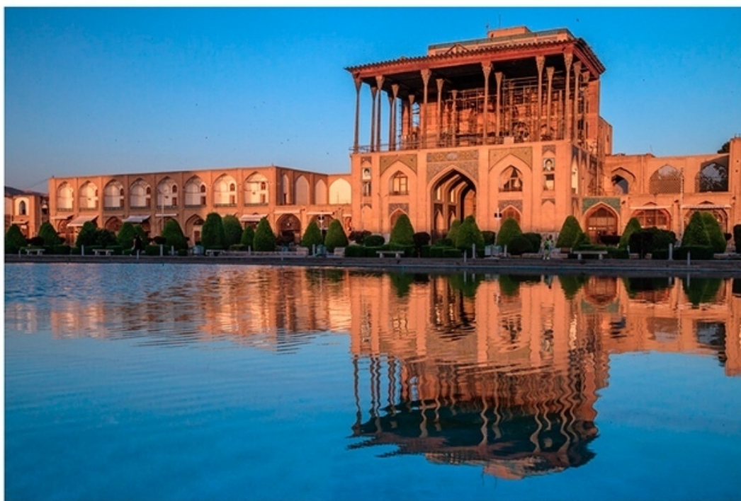
Дворец Али-Капу на площади Нагше-Джахан г. Исфахан

Напротив мечети Шейха Лотфоллы вас ждет чудесное, хоть и светское сооружение – дворец Али-Капу (пл. Нагше-Джахан (площадь Имама)). Открыто: 9.00-16.30 (закрывается по пятницам в первой половине дня), с балкона которого шах Аббас I некогда наблюдал за игрой аристократов в чоуган. Строился четырехэтажный шахский дворец с великолепной верандой в 1597-1619 гг., а знаменитый «Музыкальный зал» к нему присоединили позднее (в 1643 г.). Ныне 38-метровое сооружение кажется нам скромным, но в XVII в. оно было самым высоким в Иране! Тогда Али-Капу с 52 залами считался и самым большим дворцом из когда-либо строившихся для шахов. Али-Капу примерно переводится как «Высшие врата». Ведь шах Аббас перенес в Исфахан дверь мавзолея Имама Али из Наджафа (Ирак), взамен подарив святилищу роскошную дверь из серебра и золота, созданную исфаханскими ремесленниками.