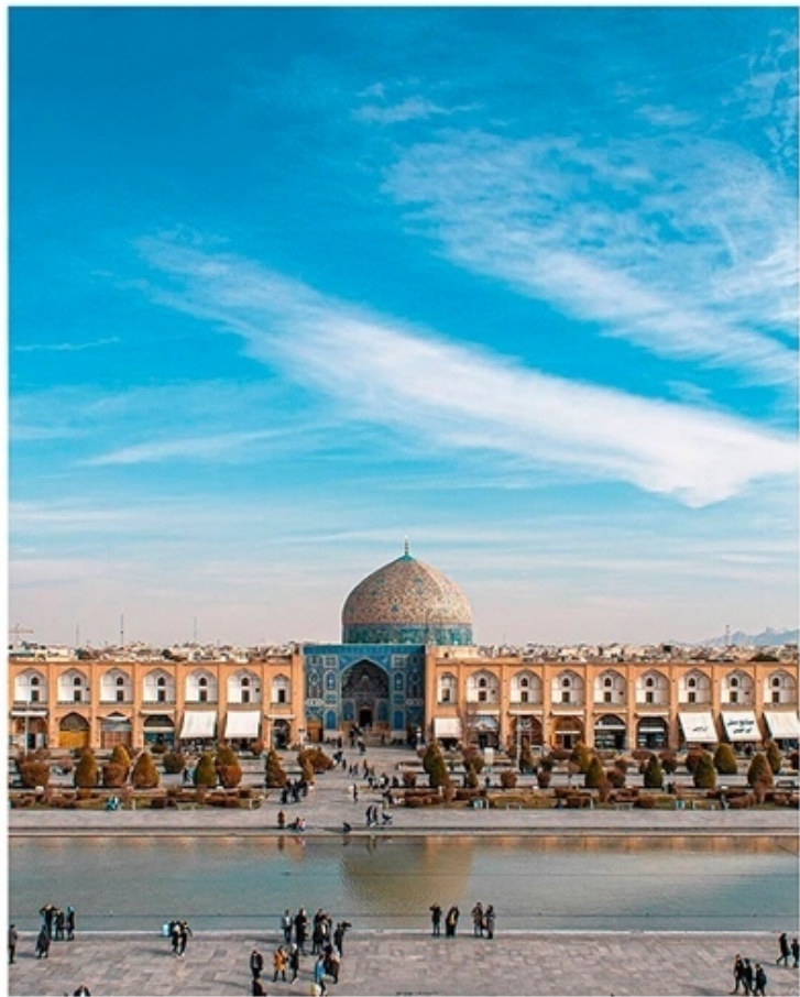
Площадь Нагше-Джахан (площадь Имама) г. Исфахан