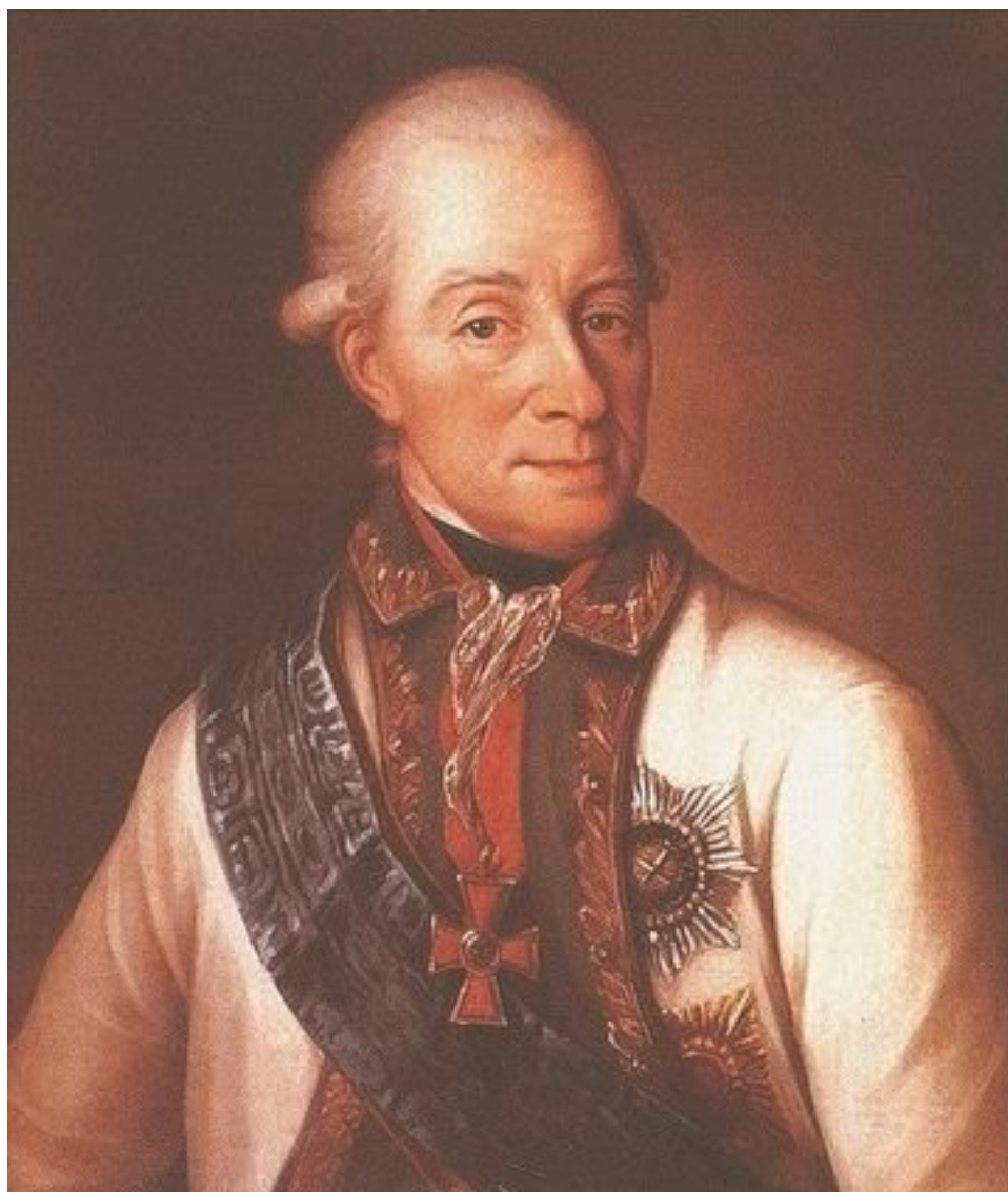
Адмирал Чичагов П.В.

– Даже ежели по всем сусекам скрести, то более пяти кораблей линейных не наскрести. А с таковыми силами можно лишь геройски помереть, но одолеть шведа никак, ибо против силы надобно выставлять таковую же силу, а оной у меня, увы, матушка, нету!