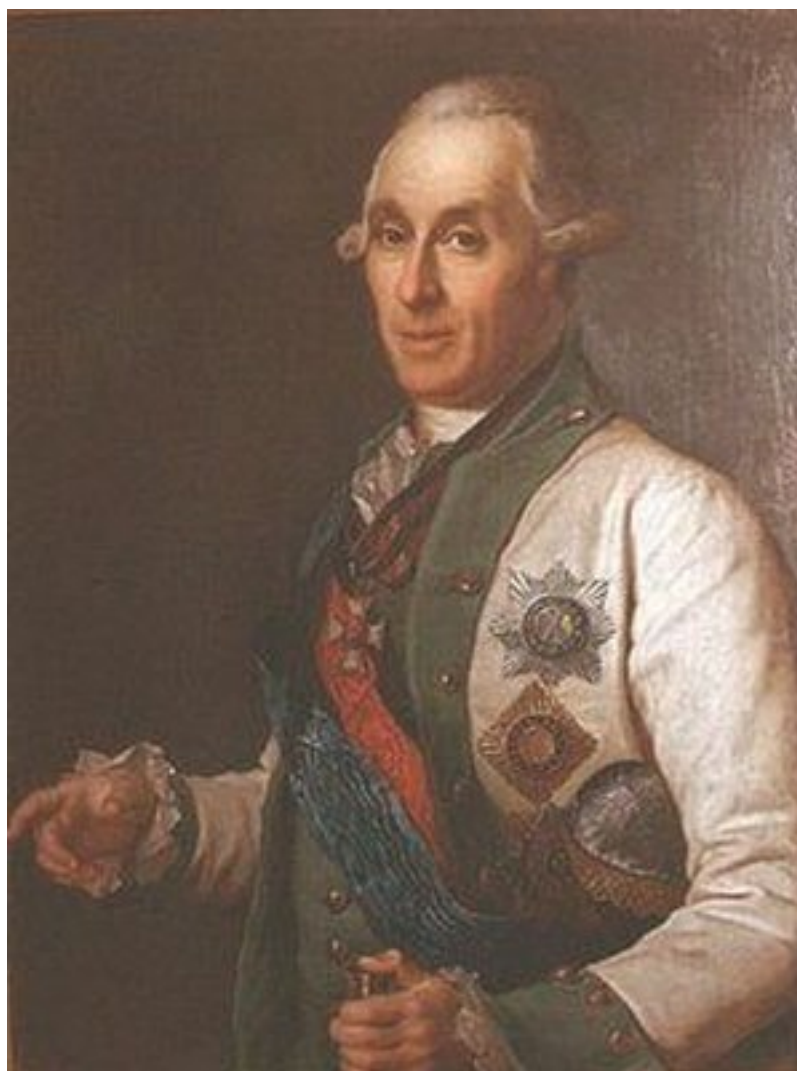
Самуил Карлович Грейг

– Вот, матушка, – сказал он, – Полюбуйся! Желаю я по прибытии своем на море Медетеранское форсировать сей пролив злосчастный и, разбив батареи неприятельские, встать на шпринг подле дворца султанского, бомбардируя его беспощадным образом, покуда злодей пощады и мира у тебя не попросит!