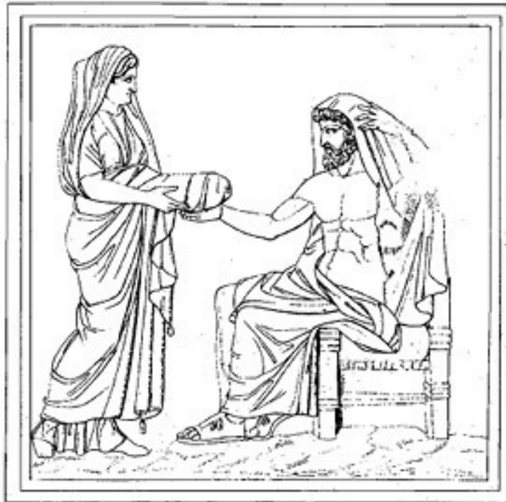
Кронос получает камень вместо Зевса

Однако, пытаясь не повторить участь отца, Кронос все-таки допустил ту же ошибку: он не принял во внимание материнские чувства жены. Как и Гею, Рею привела в ярость судьба ее детей, и, как и Гея, Рея тоже решила вмешаться в происходящее.