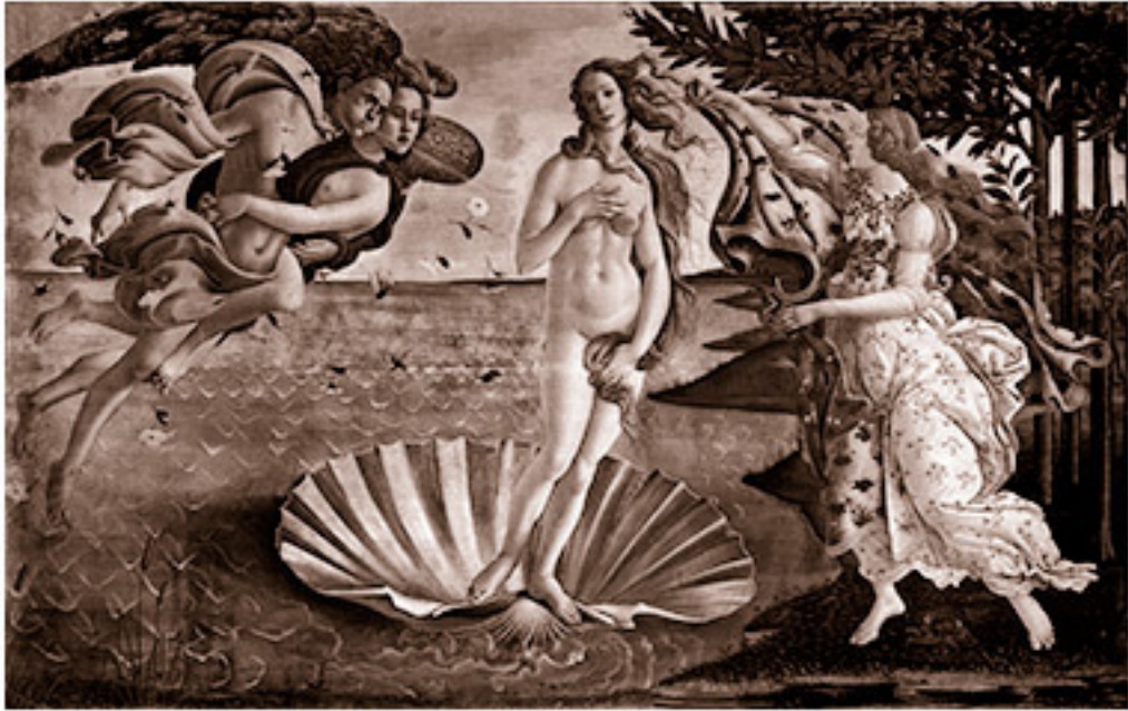
Рождение Афродиты: версия Боттичелли

в Италии ракушка была метафорой как раз для той части тела, которую Венера прячет на этой картине).