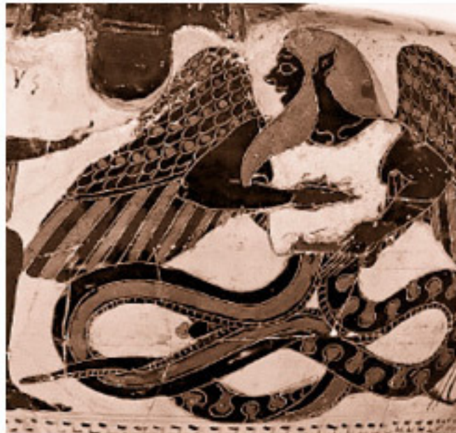
Тифон, пораженный молнией Зевса (деталь)