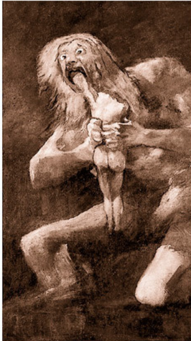
Кошмарное изображение Кроноса у Гойи

Но в конце концов Кронос потерпел поражение, и титанов, сражавшихся на его стороне, заперли в Тартаре.