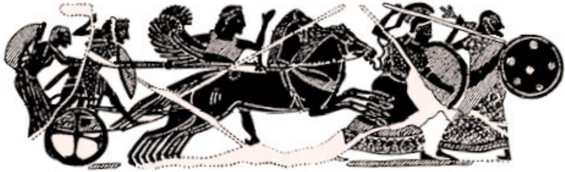
Боги, отправляющиеся на битву с гигантами (с греческой вазы работы Никосфена)