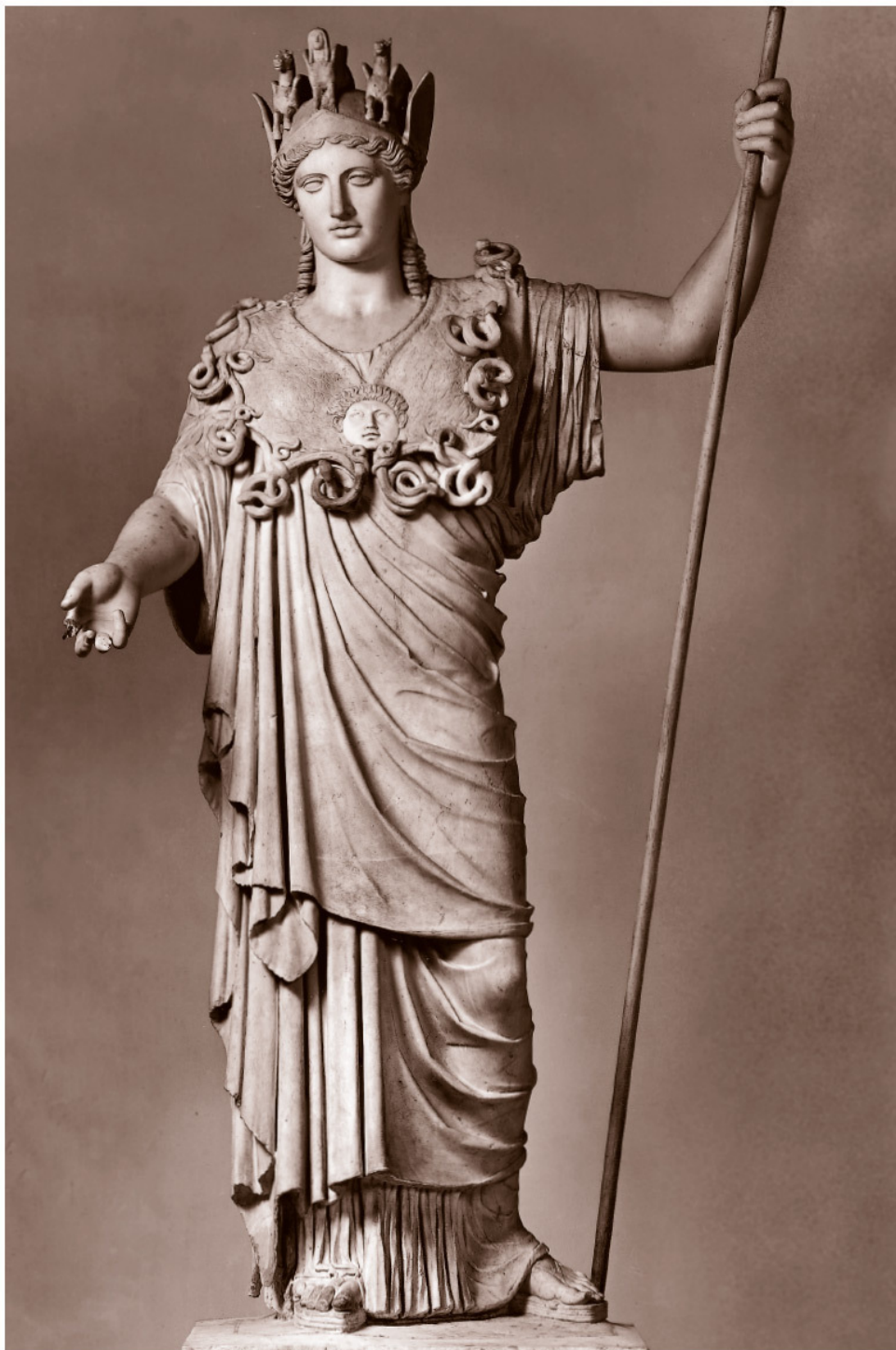
Статуя Афины (римская копия с греческого оригинала)