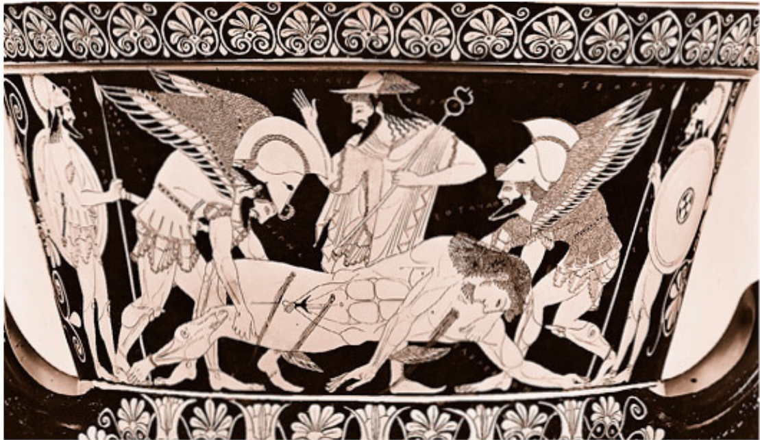
Крылатые Сон и Смерть уносят смертельно раненного героя (аттическая ваза, около 510 года до н. э.)

возрасте предположительно 23 лет. Она привлекла внимание многих художников и других деятелей искусства того времени – ее называли первой красавицей Флоренции. Несмотря на повышенный интерес к себе (и намек автора на внебрачные связи), имела репутацию благопристойной дамы. Есть версия, что многие женские образы в своих картинах Боттичелли писал именно с Симонетты. Подтвердить или опровергнуть это сложно, поскольку точных портретов девушки не сохранилось. Прим. ред.