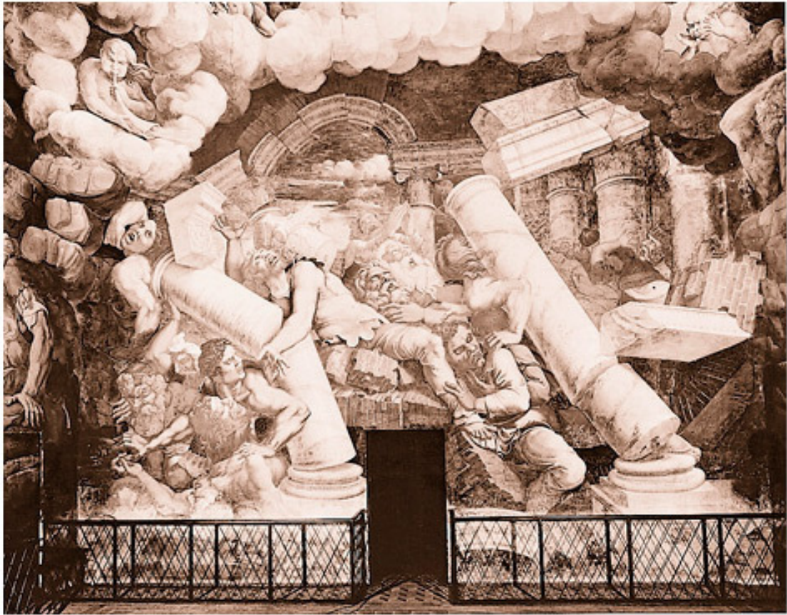
«Война на небесах»: фреска Джулио Романо

Последним и самым страшным соперником, бросившим вызов власти Зевса, стал Тифон – стоголовый, ураганный, дышащий огнем. Тифон был младшим сыном Геи, и ему почти удалось обеспечить силам беспорядка и тьмы победу. Но Зевс поразил Тифона молниями, которые сделали для него циклопы, и сбросил его на землю, под гору Этна на Сицилии. Отсюда Тифон все еще время от времени изрыгает огонь в бессильном гневе 17 .