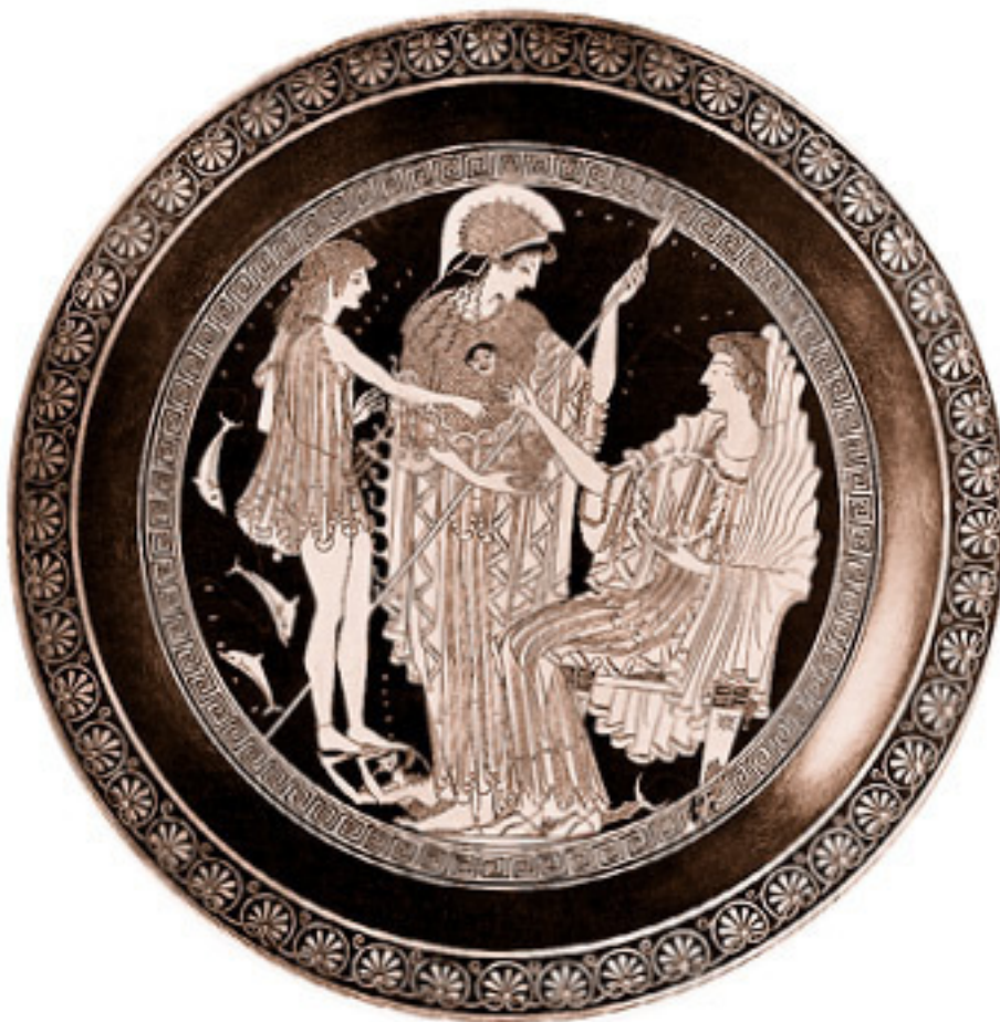
Тесей под водой получает венок от Амфитриты