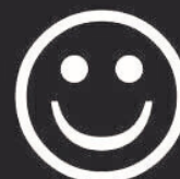
Рисунок 3 – Планка отношений