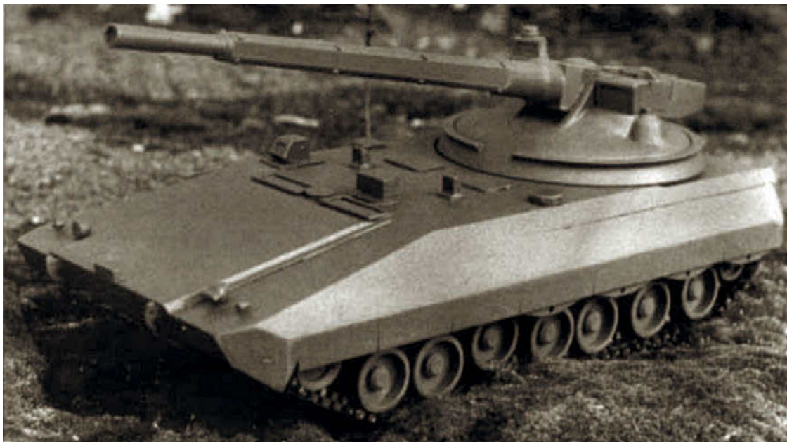
Объект 299: вид спереди. Башня на машину не установлена