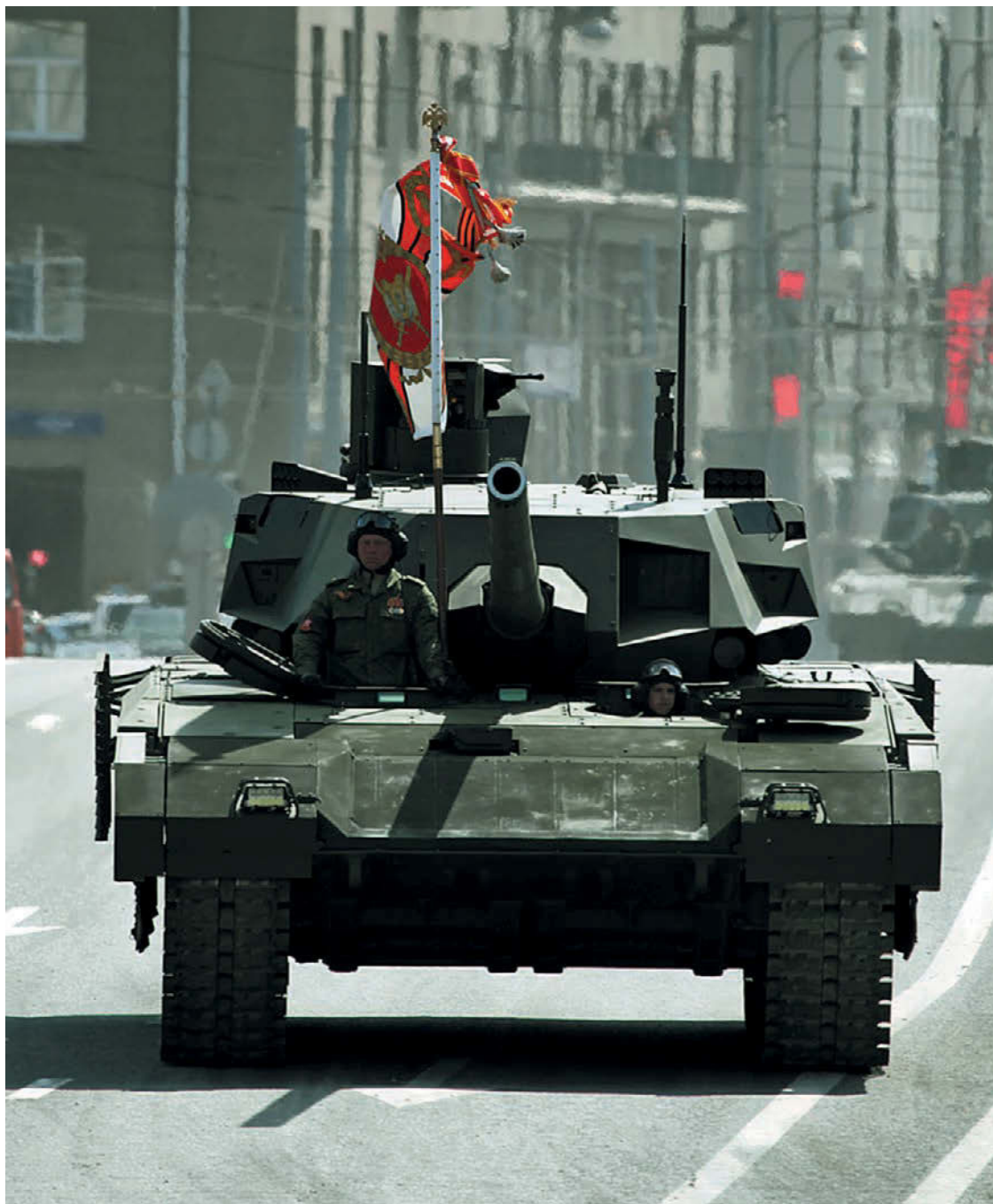
Т-14 «Армата» на Параде Победы 9 мая 2015 г.