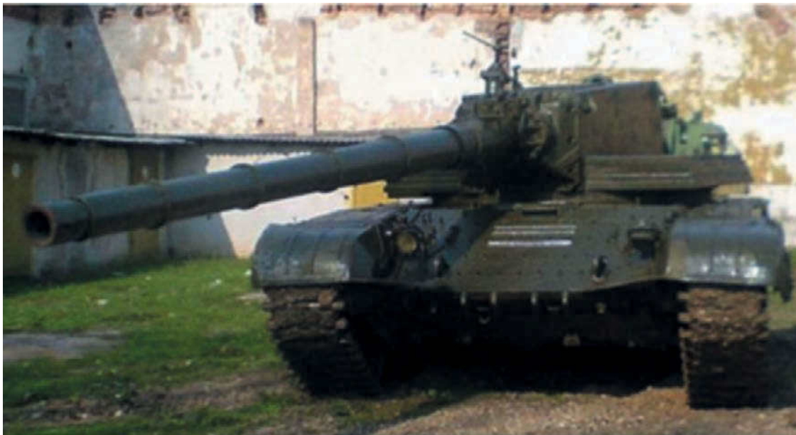
Объект 477 «Молот»

Следующий шаг вперед сделали специалисты ленинградского ОКБТ (впоследствии КБ «Спецмаш»). Их «Объект 299» изначально создавался уже как универсальная платформа, которая могла бы служить базой для разработки основного боевого танка, тяжелой БМП, инженерной машины и носителя ПТУР. Это значительно усложняло конструкторские работы, но, с другой стороны, обещало значительно удешевить производство техники и облегчить её ремонт и обслуживание.