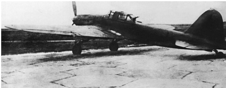
Двухместный Ил-2бис АМ-38 (зав. № 4434) с блистерной установкой под пулемет УБТ производства завода № 1. Государственные испытания, октябрь 1942 г.

Наибольшей опасности быть сбитым зениткой или вражеским истребителем штурмовик подвергался на выходе из атаки, поскольку идущий следом за ним лётчик в это время был занят атакой цели и не мог эффективно противодействовать огню противника. Иногда для подавления огневых точек в боевой группе выделялись отдельные самолёты Ил-2. В этих случаях потери от зениток уменьшались в два раза. Вспоминает Григорий Черкашин: «Самая опасная вещь, особенно в конце войны, – зенитная артиллерия. Было ее у немцев очень много, хорошо организована была, хорошие установки, радары... В полку специально готовили группы подавления МЗА, да и вообще – все следили за землей. Как начнет откуда бить – сразу ближайšie на зенитку бросаются