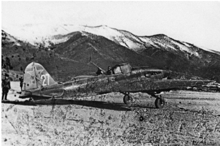
Ил-2 с самодельной оборонительной установкой под пулемет УБТ. ВВС ЧФ, 1942 г.

Отметим, что вопрос о количестве бронированных штурмовиков Ил-2, поступивших к началу войны в части приграничных военных округов, до сих пор остается открытым – данные различных архивных источников отличаются значительно. Анализ архивных документов позволяет сделать вывод, что формально к началу войны части военных округов могли получить 21 Ил-2, из них: 5 – ПрибОВО, 9 – ЗапОВО, 5 – КОВО и 2 – ОдВО. На самолет Ил-2 было переучено 60 пилотов (из 325 по плану) и 102 технических специалиста.