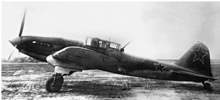
Серийный самолет Ил-2 с мотором АМ-38ф