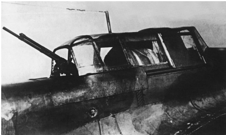
Двухместный Ил-2 АМ-38 (зав. № 887) с пулеметом УБТ-

но облегчался, улучшались условия прицеливания, повышалась точность стрельбы и бомбометания. И, что самое главное, каждый экипаж имел достаточную свободу маневра для осуществления как прицельного бомбометания и стрельбы по наземной цели, так и огневого воздействия на немецкие истребители, атакующие впередиидущий штурмовик. Во второй половине войны штурмовыми авиаполками всё чаще применялся «свободный круг». В этом случае выдерживалось лишь общее направление «круга», дистанция между Ил-2 могла изменяться, и имелась возможность выполнять довороты влево и вправо. Во всем остальном каждому летчику предоставлялась полная свобода действий.