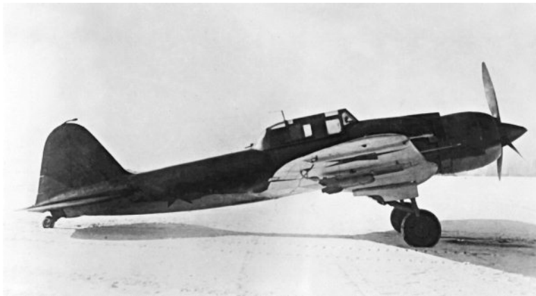
Ил-2 с М-82ИР. Государственные испытания, 1942 г. (вид сбоку)