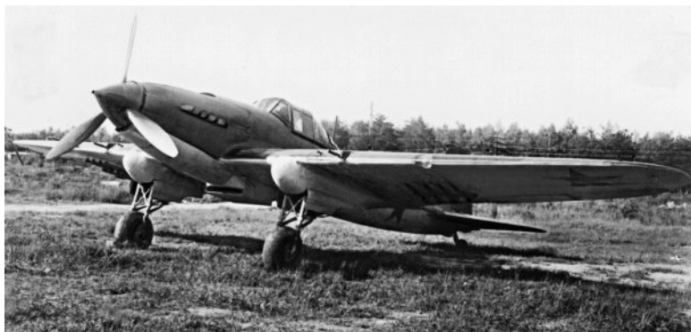
Ил-2 АМ-38 с пушками ВЯ-23, 1941 г.