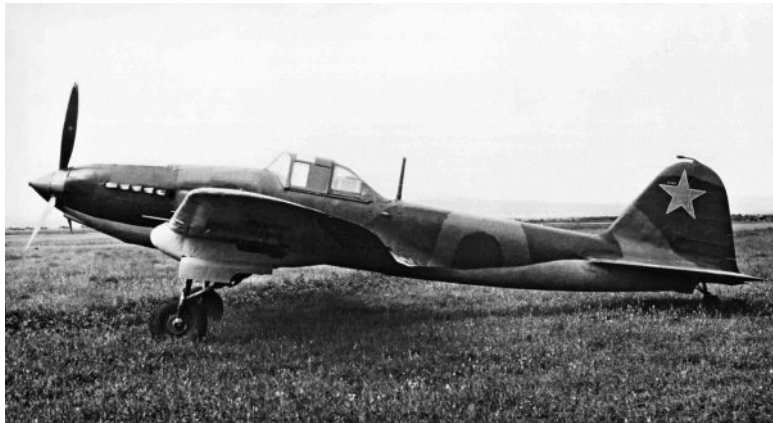
Ил-2 АМ-38 с пушками ШВАК первых серий, 1941 г.

В конце 1939 г. одноместный вариант штурмовика Ил-2 успешно прошел государственные испытания. Однако решение о серийном производстве самолётов Ил-2 было принято лишь в самом конце 1940 г., за полгода до начала войны. А первый штурмовик Ил-2 был выпущен только в марте 1941 г.