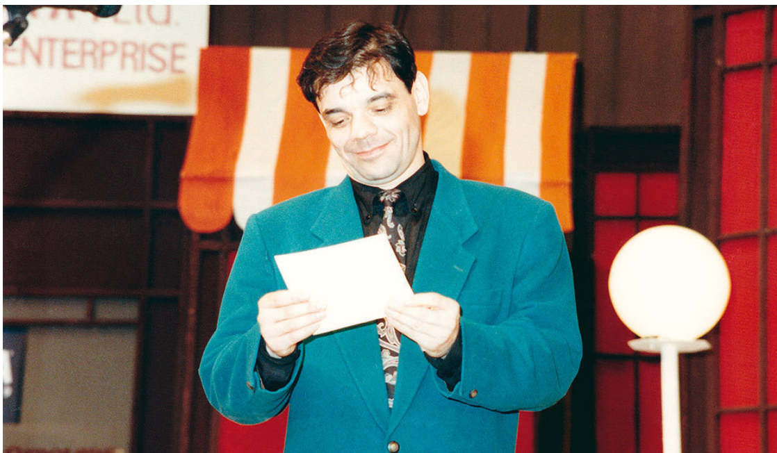
Константин Райкин с ордером на квартиру в папин дом, «MORE СМЕНА-1993»

И мы с Костей побрели дальше, оставив позади застывшую скульптуру запорожского сатирика.